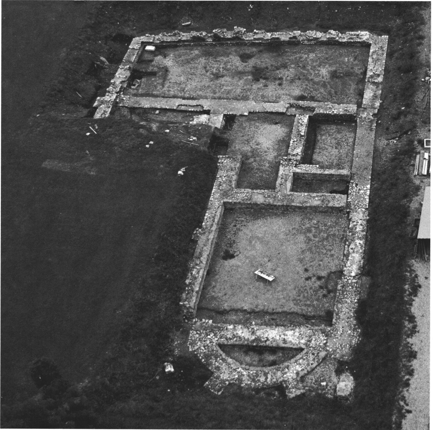
fig. 2 Vue aérienne des fouilles dans la région du grenier. Luftaufnahme einer Grabungsstelle (vgl. fig. 1A). Veduta aerea di uno scavo (vedi fig. 1A).

Le castrum d'Yverdon semble avoir été bâti vers l'an 370; sur le terrain, il a succédé au centre d'un gros vicus, d'origine helvète au moins. Les couches archéologiques les plus anciennes de l'emplacement du castrum (et environs) ont en effet livré un tesson hallstattien, un minuscule débris de coupe grecque noire à figures rouges