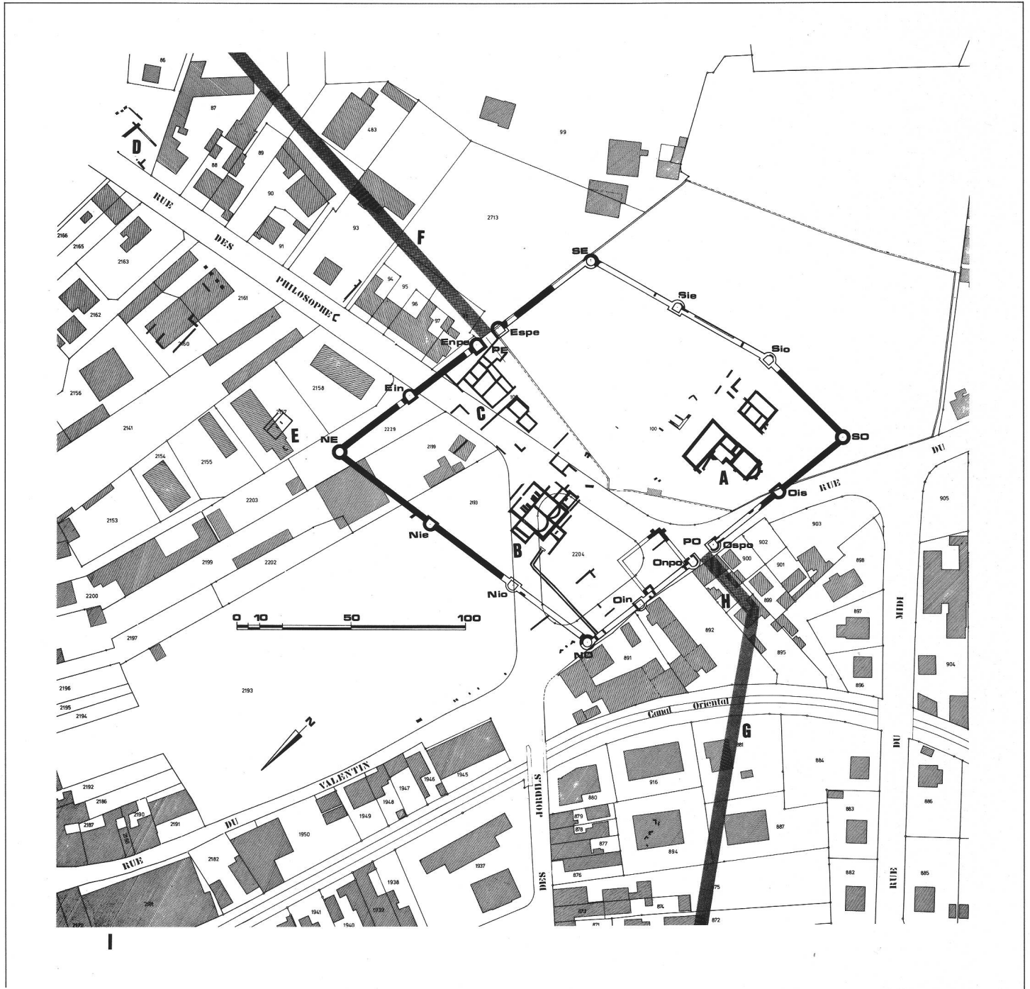
fig. 1 Plan archéologique du castrum d'Yverdon. Dessin Section M. H. et A. A grenier (fouilles 1903-1974-1975); B thermes (fouilles 1906); C habitation (fouilles 1958); D cabanes de l'époque de La Tène (fouilles 1961); E habitat La Tène et Ier siècle après J.-C. (fouilles 1945); F route vers Avenches et Moudon; G route vers Ste-Croix; H pont(?); I emplacement de la barque romaine (1971). Nomenclature des tours: N, n: Nord; E, e: Est; S, s: Sud; O, o: Ouest; P: porte; p: tour de porte; i: intermédiaire. Plan des Kastells Yverdon. Pianta del castrum di Yverdon.