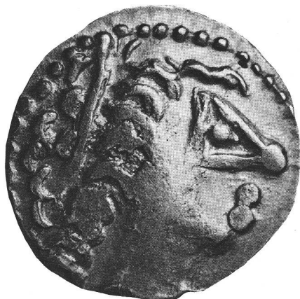
132 Monnaie gauloise en argent du type dit de »Martigny«, trouvée dans le temple gallo-romain.