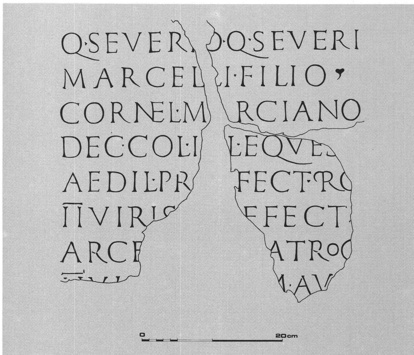
fig. 2 Fac-similé de l'inscription. Faksimile der Inschrift. Facsimile dell'iscrizione.

»A Quintus Severius Marcianus, fils de Quintus Severius Marcellus, de la tribu Cornelia, décurion de la Colonia Julia Equestris, édile, préfet remplaçant les duumvirs, préfet à la répression du brigandage, duumvir..., flamine d'Auguste,...«