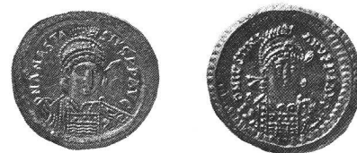
Solidus de Anastase (491-518) frappé à Constantinople (à gauche). - Solidus de Justinien (527-565) frappé à Constantinople (à droite). Ech. 1:1.

Une autre partie de cette nécropole, aux tombes orientées Est-Ouest, a été fouillée en 1974. Il pourrait s'agir des éléments chrétiens de la population locale (voir JbSGUF 1976 p. 274). D. Weidmann