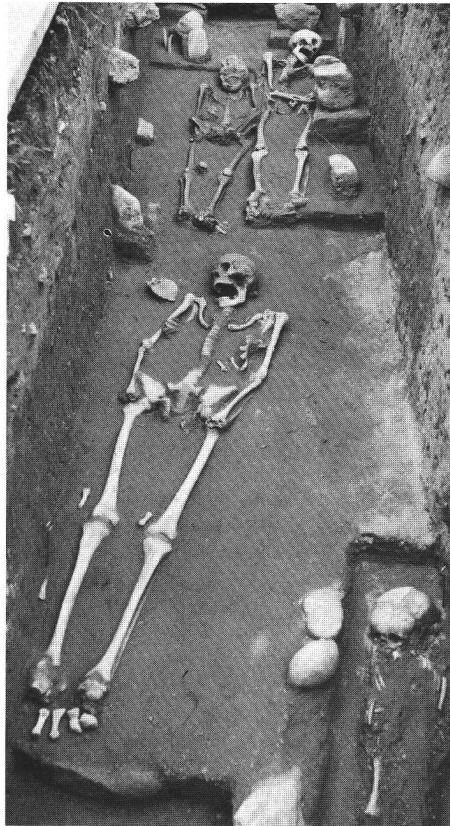
Gurmels/Dürrenberg. Die Skelette im Sondierschnitt im Osten der Kirche.

Nach der Überlieferung wurde die Kapelle 1339 nach dem Laupenkrieg im Anschluss an ein Gelübde der Einwohner des Dorfes erbaut und unter zwei Malen erweitert (1662 und 1710). Die Sondierungen wur-