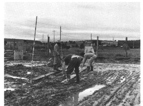
Cressier/Praz Rond, 1982. Site du bronze moyen.