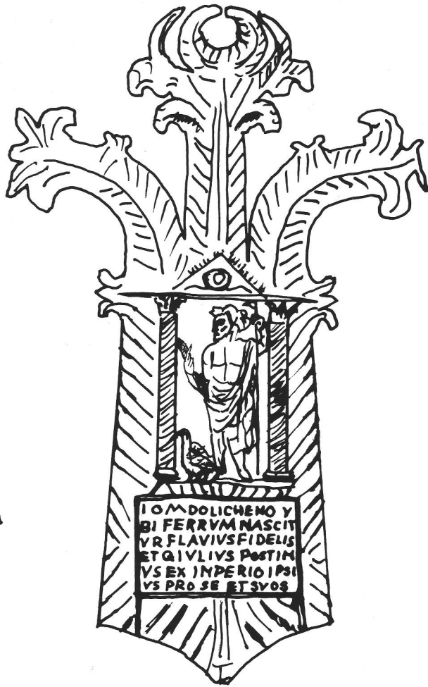
Abb. 3 Nachzeichnung des silbernen Ex-Voto-Plättchens für Jupiter Dolichenus von Mauer an der Url, Niederösterreich (Kunsthistorisches Museum Wien). Nach M.-P. Speidel, Jupiter Dolichenus (1980) Abb. 40. Dessin de l'ex-voto en argent dédié à Jupiter Dolichenus de Mauer an der Url. Disegno dell'ex-voto d'argento dedicato a Jupiter Dolichenus di Mauer an der Url.