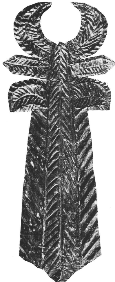
Abb. 2 Goldenes Ex-Voto-Plättchen vom Tempelbezirk Allmendingen bei Thun. M. 1:1. Stilisierter Baum mit Blattwerk und Mondsichel. Der Typus solcher silberner und goldener Ex-Voto-Folien wird in den Tempeln orientalischer Gottheiten deponiert. Sie kommen mit oder ohne Inschrift des Stifters vor. Ex-voto en or de Thun-Allmendingen. Ex-voto d'oro del santuario di Thun-Allmendingen.