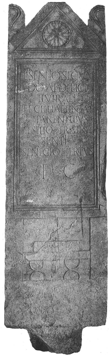
fig. 3 Stèle de L. Sentius Secundus et de Gellia Tinda. Ht. 240cm (sans le talon). Grabstele des L. Sentius Secundus und der Gellia Tinda. Stele funeraria di L. Sentius Secundus e di Gellia Tinda.