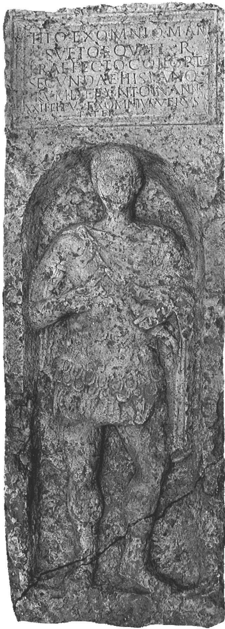
fig. 1 Stèle de Titus Exomnius Mansuetus. Ht. 230cm. Grabstele des Titus Exomnius Mansuetus. Stele funeraria di Titus Exomnius Mansuetus.