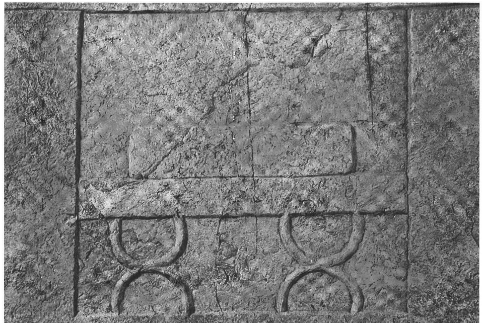
fig. 4 Détail de la sella curulis de la stèle fig. 3. Detail mit der sella curulis. Dettaglio con la sella curulis.