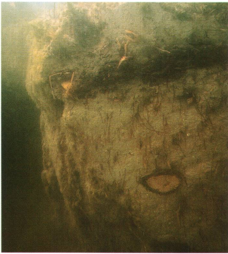
Abb. 2 Risch-Buonas. Tauchsondierung. Detail der jungsteinzeitlichen Kulturschicht. Risch-Buonas. Sondage subaquatique. Détail de la couche archéologique néolithique. Risch-Buonas. Sondaggio subacqueo. Dettaglio di uno strato antropico neolitico.