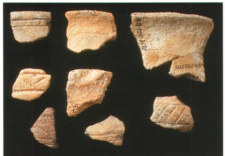
Abb. 6 Cham-Oberwil, Hof. Keramikscherben der Glockenbecher Kultur (ca. 2500- 2200 v. Chr.). Cham-Oberwil, Hof. Tessons de céramique campani- forme (env. 2500- 2200 av. J.-C.). Cham-Oberwil, Hof. Frammenti ceramici del Campaniforme (ca. 2500-2200 a.C.).

Rinder, Schweine, Schafe und Ziegen wurden vom Menschen als Haustiere gehalten und dürften teilweise auch innerhalb des Dorfes gelebt haben. Nebst dem begehrten Fleisch lieferten sie auch Häute, Sehnen, Knochen und Horn. Auf den ausserhalb der Dörfer gelegenen Äckern wurden verschiedene Getreidearten (Nacktweizen, Emmer, Einkorn, Gerste), Erbse, Schlafmohn und Lein kultiviert. Nicht nur zur Bereicherung des Speisezettels, sondern auch zum Überleben bei Missernten oder Tiererepidemien wurden in der umliegenden Gegend zahlreiche Wildtiere erlegt. Am wichtigsten war der Hirsch, der mit seinem Geweih gleichzeitig auch Lieferant für einen begehrten Rohstoff war. Aber auch Ur, Reh, Elch, Wildschwein, Braunbär,