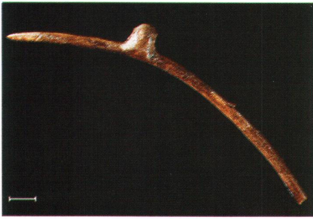
Abb. 5 Steinhausen-Sennweid. Gebogene Netznadel aus Hirschgeweih der späten Horgener Kultur (29. Jahrhundert v. Chr.). Strichlänge: 1 cm; Foto KA ZG, H. Bichsel. Steinhausen-Sennweid. Aiguille à filocher en bois de cerf, datant de la phase finale du Horgen (29ème siècle av. J.-C.). Steinhausen-Sennweid. Ago da reti ricurvo in palco cervino della tarda cultura di Horgen (XXIX secolo a.C.).

der Zuwanderung neuer Bevölkerungsgruppen gerechnet wird.