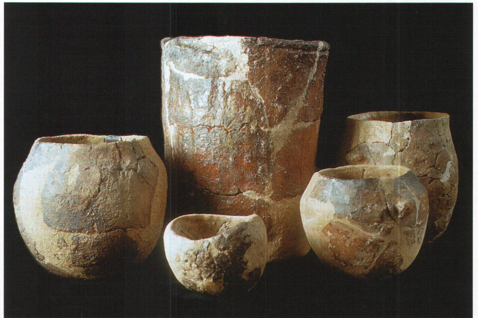
Abb. 4 Steinhausen-Sennweid. Keramikgefässe der späten Horgener Kultur (29. Jahrhundert v. Chr.). Steinhausen-Sennweid. Récipients en céramique de la fin du Horgen (28ème siècle av. J.-C.). Steinhausen-Sennweid. Recipienti in ceramica della tarda cultura di Horgen (XXIX secolo a.C.).

Die teilweise markanten Veränderungen in der materiellen Sachkultur ereigneten sich in der Ostschweiz gemäss heutiger Erkenntnis teilweise derart rasch, dass mit