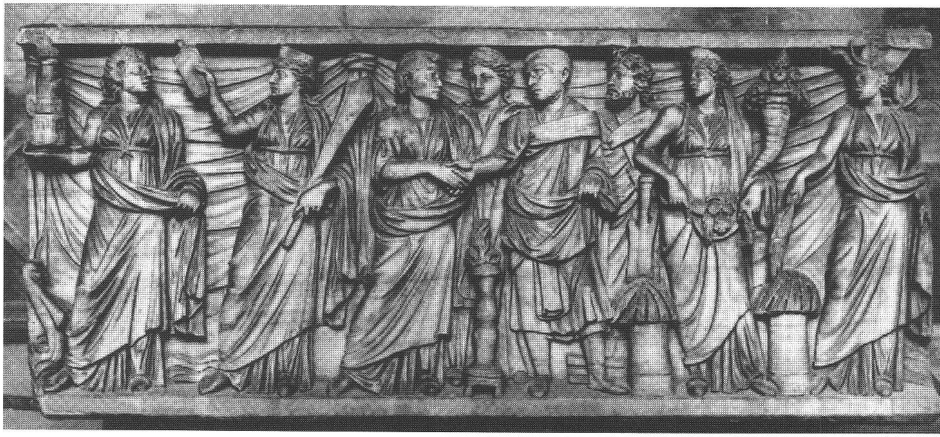
Abb. 6 Marmorsarkophag des Flavius Arabianus(?), H. 85 cm; Frontansicht. Rom, Museo Nazionale delle Terme. Vgl. Uggeri (Anm. 32) 114. Vue de face du sarcophage en marbre de Flavius Arabianus(?). Sarcophage marmoreo di Flavio Arabiano(?). Visione frontale.