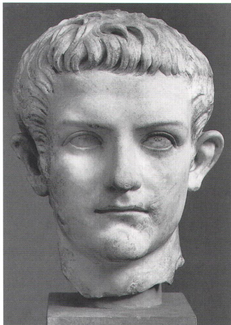
Abb. 3 Marmorkopf des Kaisers Caligula, H. 30 cm; Vorderansicht. Kopenhagen, Ny Carlsberg Glyptothek. Vue de face du portrait en marbre de l'empereur Caligula. Testa marmorea dell'imperatore Caligola. Visione frontale.