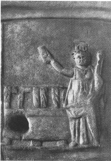
Abb. 7 Rundbasis(?) aus Marmor mit Roma, Sicilia und Annona, H. 30 cm; Teilansicht mit Annona. Rom, Vatikan, Galleria dei Candelabri. Base runde(?) de marbre avec les déesses Roma, Sicilia et Annona; vue partielle avec Annona. Base(?) marmorea rotonda con le personificazioni di Roma, Sicilia con Annona. Dettaglio de Annona.

Kombination mit dem Herrschaftssymbol der Weltkugel auf 27 .