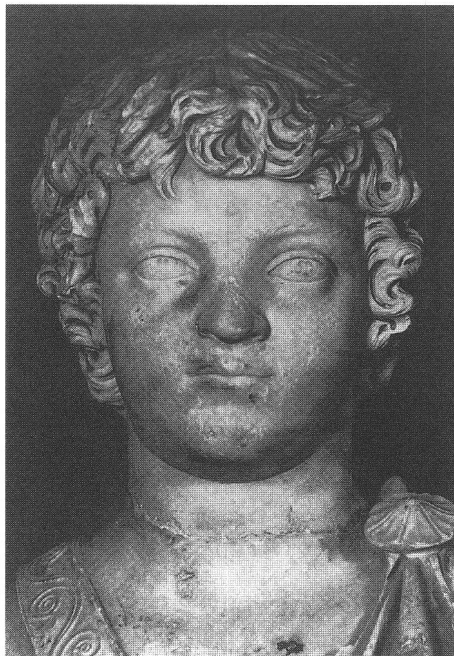
Abb. 5 Marmorbüste des Prinzen Caracalla (196 n. Chr.), H. 62 cm; Vorderansicht des Kopfes. Rom, Museo Nazionale delle Terme. Vgl. Wiggers (Anm. 16) Taf. 1. Vue de face du buste en marbre du prince Caracalla. Busto marmoreo del principe Caracalla. Visione frontale della testa.

Für die eingangs erwähnte Ausstellung »Götter, Berge, Menschen« ist die Marmorstatuette neu zusammengesetzt und fotografiert worden (Abb. 4a-g). Im neuen Licht treten Züge zum Vorschein, die die zeitliche Einordnung der Marmorstatuette wesentlich erleichtern. Im Gesicht und in der Kopfform der Göttin (Abb. 4g) scheint das Bildnis des 10jährigen Prinzen Caracalla durch (Abb. 5) 16 : hier wie dort dieselben gedrängten kindlichen Gesichtszüge im vollen Rund der noch wenig artikulierten Physiognomie. Früher als dieses Prinzenporträt ist die Statuette der Göttin von Thun-Allmendingen nicht entstanden, eher etwas später mit der der Kleinkunst eigenen stilistischen Retardierung. Zwar weicht die pastose Wiedergabe der Haarwellen unserer Göttin von den durch Bohrungen präzise gezeichneten Locken des Prinzen Caracalla ab. Bei einem Bildnis jedoch desselben Prinzen aus Ägypten bleiben die Locken ohne die Aufbohrungen des römischen Bildnisses. Vergleichbar mit den Augen der Marmorstatuette ist hier auch die verhaltene Augensternbohrung 17 . Die Entstehung der Statuette am Ende des 2. bis Anfang des 3. Jahrhunderts n. Chr. 18 macht nun auch die formalen Diskrepanzen verständlich, die zunächst sogar an eine nachträgliche Umarbeitung in antiker Zeit denken liessen. Steife Proportionen, linearer Faltenwurf mit in der Vorderseite tiefen Faltentälern, wie unfertig wirkende