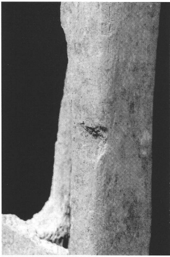
Abb. 2 Schnittspur am Margo interosseus des Schienbeines eines erwachsenen, wohl männlichen Individuums aus der Grube 178. Trace de découpe sur le tibia d'un individu adulte de sexe vraisemblablement masculin provenant de la fosse 178. Traccia di taglio sulla tibia di un individuo adulto e probabilmente di sesso maschile dalla fossa 178.