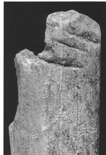
Abb. 1 Oberschenkelschaft eines 10- bis 14jährigen Individuums aus der Grube 217. Gut sichtbar sind die fünf Hackspuren am proximalen Schaftende.

Etwa 46% der Fundstücke entfallen auf Schädel oder Schädelteile, weitere 31% auf Oberschenkel-, Unterschenkel- und Oberarmknochen, 23% auf weitere Teile des menschlichen Skelettes. Diese Verteilung lässt auf einen Ausleseprozess schliessen, der menschlicher, wie aber auch natürlicher Art sein kann. Spuren einer aktiven, vom Mensch vorgenommenen Zerteilung sind selten. Von den 73 erhaltenen postcranialen Einzelknochen tragen gerade vier Elemente Hack- oder Schnittspuren. Teilweise treten diese Spuren wie im Fall des in Abbildung 1 sichtbaren Oberschenkels mehrfach auf. Der Oberschenkel eines 10- bis 14jährigen Kindes wurde am oberen Ende durch fünf Hackspuren getrennt. Die Hiebe wurden dabei von hinten geführt.