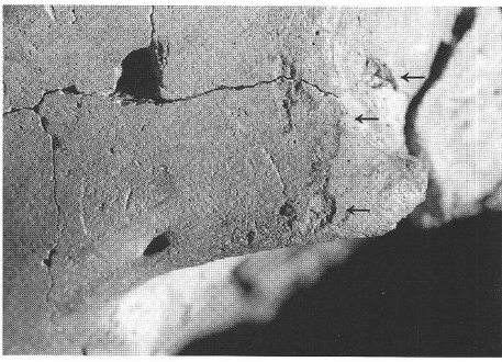
Abb. 5 Schädel einer ca. 20jährigen Frau aus der Grube 255. Deutlich sichtbar sind die Zahneindrücke über dem linken Augenhöhlerdach. Crâne d'une femme d'une vingtaine d'années provenant de la fosse 255. Les empreintes de dents sont bien visibles au-dessus de l'orbite gauche. Cranio di una donna di circa 20 anni dalla fossa 255 con evidenti tracce provocate da morsi al di sopra dell'orbita sinistra.