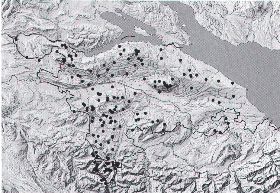
Abb. 1 Vor 1920 abgegangene mittelalterliche Siedlungen, die mit mindestens 200 m Genauigkeit lokalisiert sind. Les agglomérations médiévales disparues avant 1920 dont la position est connue à 200 m près. Insediamenti medievali, abbandonati prima del 1920, localizzati con almeno 200 m di precisione.

Die Erforschung mittelalterlicher, heute verschwundener Siedlungen, sog. »Wüstungen«, kann unter gänzlich verschiedenen Aspekten angegangen werden: Eine eher historisch interessierte Wüstungsforschung versucht, einzelne »Wüstungsphasen« zu identifizieren und deren Ursachen zu ermitteln. Eher geographisch hingegen ist die Frage nach Veränderungen der Siedlungs- und Verkehrsstruktur, welche mit dem Abgang gewisser Siedlungen verbunden waren. Und das besondere Interesse der Archäologie liegt naturgemäss bei der einzelnen Siedlung. Dabei interessieren vor allem eine genaue Lokalisierung und eine detaillierte Untersuchung bis hin zur Ausgrabung.