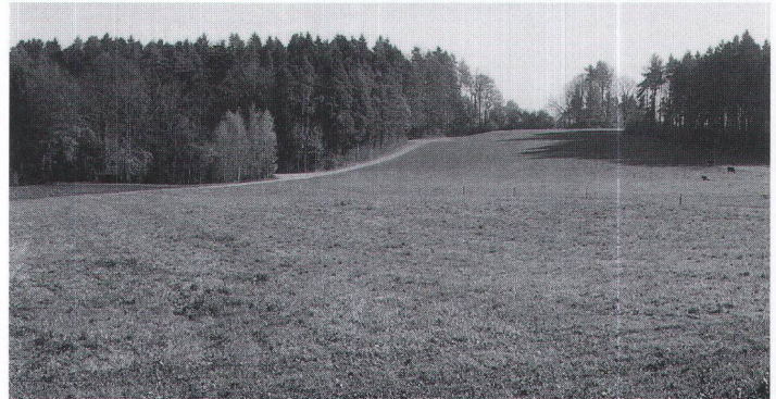
Abb. 6 Die heutige langgezogene Lichtung auf der obersten Geländeterrasse bei Ärwilen. La clairière longiligne de nos

vor der Brüggischen (...)« Anonymer Plan 1760. Privatbesitz. Une continuité d'occupation remarquable. Sorprendente prolungamento del terreno.