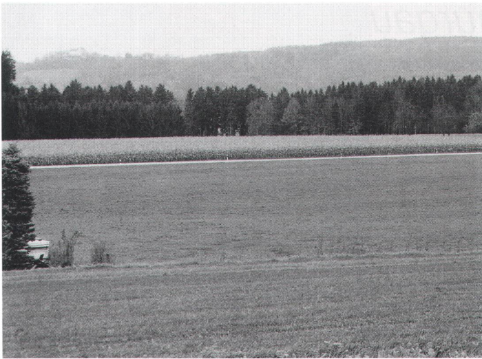
Abb. 2 Die Flur Schauelen/Schowingen. Im Hintergrund Schloss Sonnenberg. Le lieudit Schauelen/Schowingen. A l'arrière-plan, le château de Sonnenberg. Il terreno Schauelen/Schowingen. Sul fondo il castello Sonnenberg.