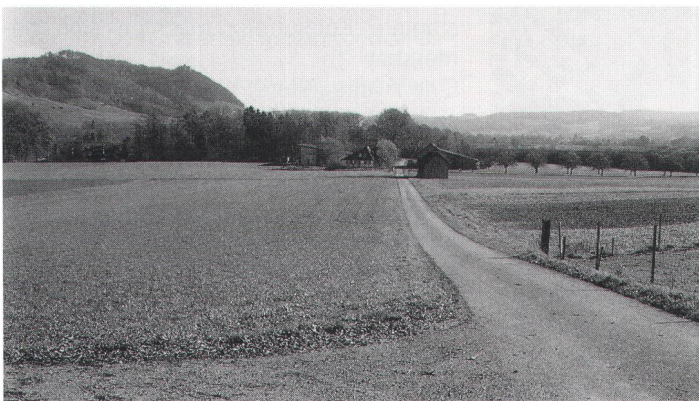
Abb. 4 Die heutige Lichtung »Sepling« mit dem im 20. Jahrhundert neugebauten Hof. Im Hintergrund Schloss Hohenklingen. La clairière contemporaine »Sepling« et sa ferme, recons- truite ce siècle. A l'arrière- plan, le château de Hohenklingen. L'odierna radura »Sepling« con il podere costruito recentemente nel XX secolo. Sul fondo il castello Hohenklingen.

La carte du canton de Thurgovie au 1:25'000e établie vers 1835 par Johann Jacob Sulzberger est une source de première importance. Una fonte importante è la carta 1:25'000 del cantone Turgovia, di Johann Jacob Sulzberger, datata attorno al 1835.