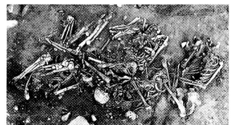
Spreitenbach-Moosweg 1997. Dritte Lage der Skelette. Beil und Sprossengerät in situ.

Unter einer knapp unter der heutigen Grasnarbe liegenden Steinpackung lagen auf engstem Raum mehrere menschliche Schädel und weitere Skelettteile. Zu Beginn der sofort in die Wege geleiteten Ausgrabung waren auf den ersten Blick praktisch keine Knochen im anatomisch korrekten Verband zu erkennen. Erst nach dem sorgfältigen Freilegen und dem Beizug einer Anthropologin stellte sich heraus, dass auf einer Fläche von knapp 4 m 2