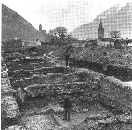
Abb. 1 Martigny VS. Römische Ausgrabungen in Les Morasses in den Jahren 1896/97. Martigny VS: fouilles gallo-romaines sur le site des Morasses, dans les années 1896/97.

Noch bestanden jedoch unterschiedliche gesetzliche Grundlagen für die Denkmalpflege und die Archäologie einerseits, den