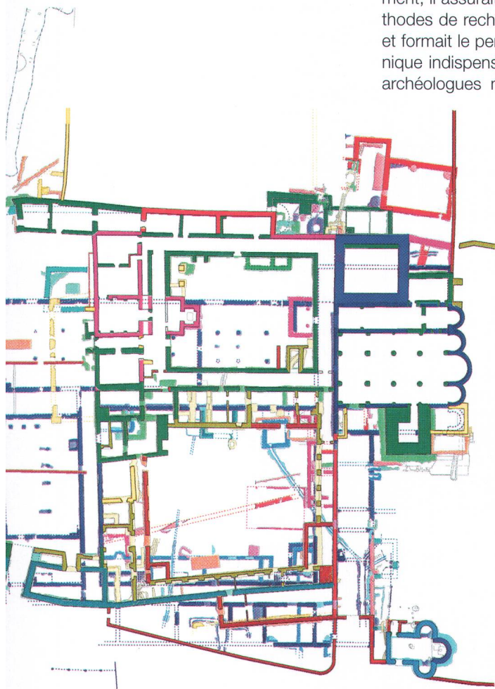
Abb. 1 Mit der archäologischen Forschung gewinnt das mittelalterliche Kloster St. Johann in Münstair GR an Farbe und Bedeutung: Bronzezeitlicher Pfostenbau (rot) - spätantiker Pfosten- bau (grün) - karolingisches Kloster (blau) - ottonischer Wohn- und Wehrturm (violett) - hochmittelalter- liche Bischofsresidenz (rosa) - spätmittelalterliches Kloster mit barocken Zubauten (grün, gelb). Aus: Veröfentl. Inst. Denkmalpflege ETH Zürich 16.1 (Zürich 1996), erwei- tert.

L'étude archéologique du couvent médiéval de St Jean à Münstair a permis de mieux comprendre l'importance de ce lieu.