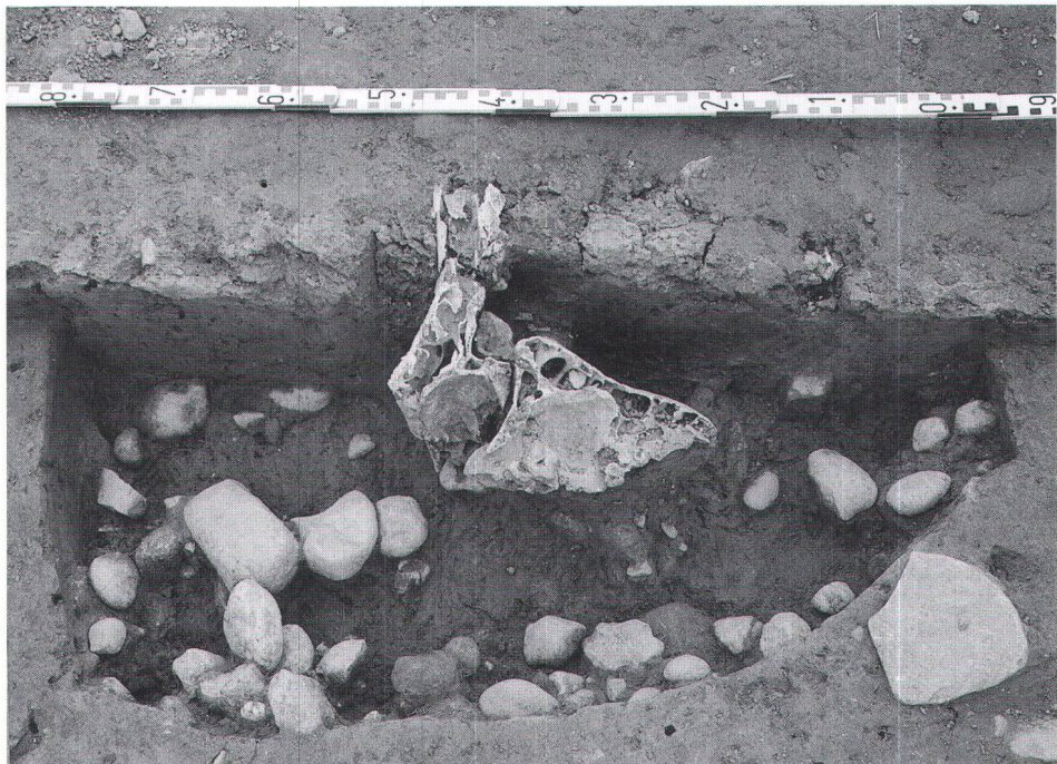
Abb. 2 Fundlage des Rinderschädels in der Grube bei der Grabanlage H. Lieu de découverte du crâne de boeuf dans la fosse près de l'ensemble funéraire H. Sito di ritrovamento del cranio di bue nella fossa presso il complesso tombale H.

der beiden knöchernen Hornzapfen vorhanden. Die Unterseite des Schädels wurde absichtlich mit einem Messer oder Beil abgeplattet. Die Schädelnähte sind noch nicht verwachsen, das heisst, das Tier war noch im Wachstum. Deshalb ist eine Geschlechtsbestimmung anhand der Hornzapfenausbildung auch problematisch; möglicherweise handelte es sich um ein weibliches Kalb.