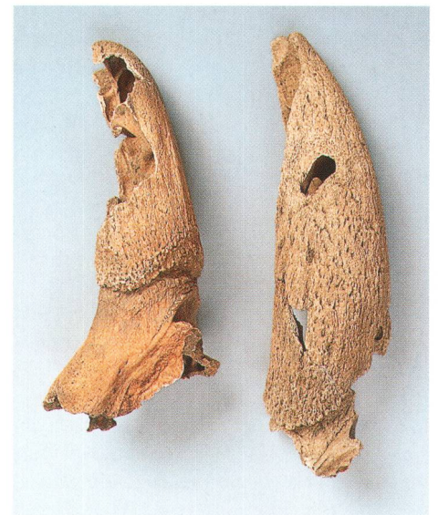
Abb. 5 Die Hornzapfen aus der Keller- grube im Vorratsgebäude D. Chevilles osseuses provenant de la fosse-cave de l'entrepôt D. Perno di corno proveniente dalla fossa nel magazzino D.