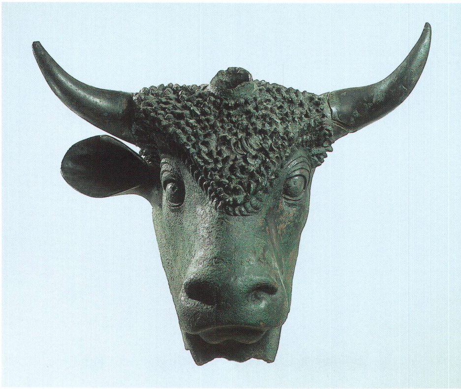
Abb. 6 Kopf eines dreiehörnten Stieres aus Martigny VS. Römisch, 1.-2. Jahrhundert n. Chr., Bronze, Höhe 51,5 cm. Musée Gallo-romain de la Fondation P. Giannada, Martigny VS. Tête de taureau tricorne provenant de Martigny VS. Testa di toro a tre corna da Martigny VS.

Es bleibt nun noch zu fragen, wie es zu dieser »kultischen« Deponierung in einem Vorratsspeicher kam. Denkbar ist, dass diese Rinderschädel ursprünglich an der Aussenwand des Gebäudes zu dessen Schutz vor Naturkatastrophen wie zum Beispiel Blitzeinschlag befestigt waren. Dass in römischer Zeit die Sitte bestand, auch an Profanbauten tierische Skeletteile anzubringen, zeigt die Verbreitung von unbearbeitetem Geweih über das ganze Stadtgebiet von Augusta Raurica, die auch nur damit erklärt werden kann, dass Geweih aus kultischen Gründen in oder an den Häusern aufgehängt wurde 16 . Die Rinderschädel, die möglicherweise an der Biberister Scheune hingen, wurden, nachdem sie ihren Dienst erfüllt hatten, im Gebäudeinnern in einer bereits bestehenden Grube versenkt, vergleichbar dem Schädel bei der Grabanlage. Die Gutshofleute hätten vielleicht besser daran getan, sie hängen zu lassen, denn das Gebäude fiel im späteren 3. Jahrhundert einem Brand zum Opfer.