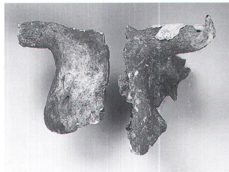
Abb. 3 Der Rinderschädel aus der Grube bei der Grabanlage H. Le crâne de boeuf de la fosse près de l'ensemble funéraire H. Il cranio di bue proveniente dalla fossa presso il complesso tombale H.

Schädel vermutlich in einer eigens für diesen Zweck gegrabenen Grube nieder 11 . So scheint es auch, dass die Grabstele Ende 2. oder anfangs 3. Jahrhundert »willeentlich umgerissen und richtiggehend begraben« wurde 12 .