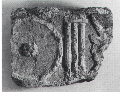
Abb. 1 Fragmentierter Block eines Frieses mit Opferschale und Rinderkopf. Gefunden 1962 in der Heidenmauer von Kaiseraugst. Bloc fragmenté d'une frise représentant une coupe à libations et une tête de boeuf. Blocco frammentario di un fregio con coppa per le offerte e testa di bue.

100 Symbolik auch in den Gebieten nördlich