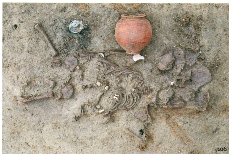
Abb. 106 Körpergrab eines Säuglings. Ausgrabungen im Herbst 2000 in der Westnekropole. Als Grabbeigaben fanden sich eine Münze und ein Keramikbecher.

Tomba ad inumazione di lattante, emersa nell'autunno 2000 nella necropoli della porta occidentale. Il corredo è costituito da una moneta e da un bicchiere.