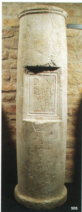
Abb. 101 Grabinschrift auf einer Säule, die 1886 in der Westnekropole entdeckt wurde. H. 1,44 m. Text und Übersetzung: D(is) M(anibus) / D(ecimi) Iul(ii) / Iuni(ani) / Iul(ia) Tit / ullin(a) / ux(or). «Den Manen des Iulius Decimus, von Iulia Titullina seiner Gattin (errichtet).»

Iscrizione funeraria su colonna di calcare, scoperta nel 1886 nella necropoli della porta occidentale. A. 1,44 m.