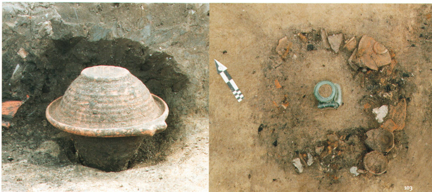
Abb. 103 Zwei Beispiele von Urnengräbern aus der Nekropole En Chaplix. 2. Jh. n.Chr.

Von der Mitte des 2. Jh. an wird, noch vor der Verbreitung des Christentums, vermutlich durch den Einfluss der orientalischen Religionen in Rom und in den Provinzen allmählich der Brauch der Körperbestattung auch für Erwachsene üblich.