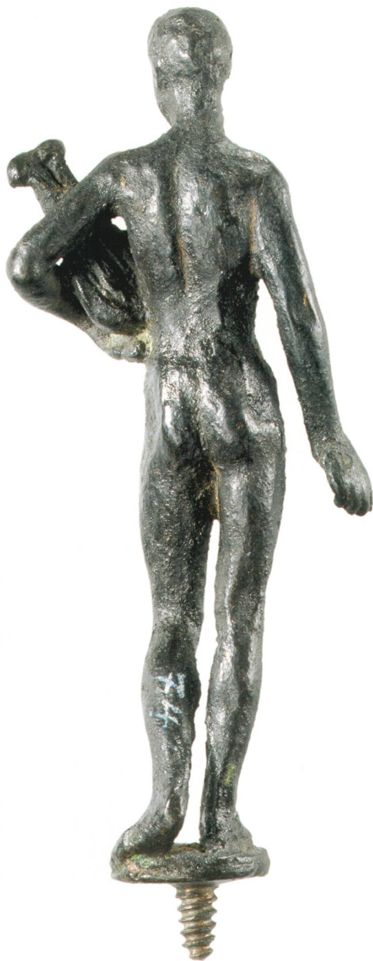
Fig. 3 Jeune homme à la lyre, de dos. Collection Levade du Musée cantonal d'archéologie et d'histoire de Lausanne. H. 9,8 cm. MCAH inv. 74.

probable du début du XIX e siècle, il est chargé du discours du moment, mélange entre nationalisme par la forme du corps reprise des statuettes découvertes sur sol français, recherche du modèle de Rome par le traitement de la tête et souscription aux formules du temps par le rendu de la lyre. Ossian et Velléda ne sont pas loin. Avenches non plus. La ville antique signifie alors l'Empire romain en Suisse. La mentionner dans une vente d'antiquité, c'est authentifier l'objet. C'est se mettre dans les pas de Goethe et de Byron. C'est s'assurer le prix fort. █