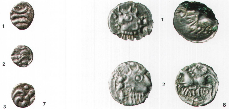
Fig. 9 Quinaire de NINNO, trouvé à Avenches, En Chaplix. Ech. 2:1.

Quinari di VATICO: rinvenimento dal Bois de Châtel (1), esemplare di provenienza incerta, conservato nelle collezioni d'Avenches (2). Sc. 2:1.