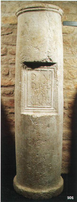
Fig. 101 Inscription funéraire sur fût de colonne en calcaire, découverte en 1886 dans la nécropole de la porte de l'Ouest. H. 1,44 m. Texte et traduction: D(is) M(anibus) / D(ecimi) Iul(ii) / Iuni(ani) / Iul(ia) Tit / ullin(a) / ux(or). «Aux Dieux Mânes de Decimus Iulius Iunianus, Iulia Titullina, son épouse (a élevé ce monument)».

Iscrizione funeraria su di colonna di calcare, scoperta nel 1886 nella necropoli della porta occidentale. A. 1,44 m. Testo e traduzione: D(is) M(anibus) / D(ecimi) Iul(ii) / Iuni(ani) / Iul(ia) Tit / ullin(a) / ux(or). «Agli dei Mani di Decimus Iulius Iunianus, Iulia Titullina, sua sposa (ha eretto questo monumento)».