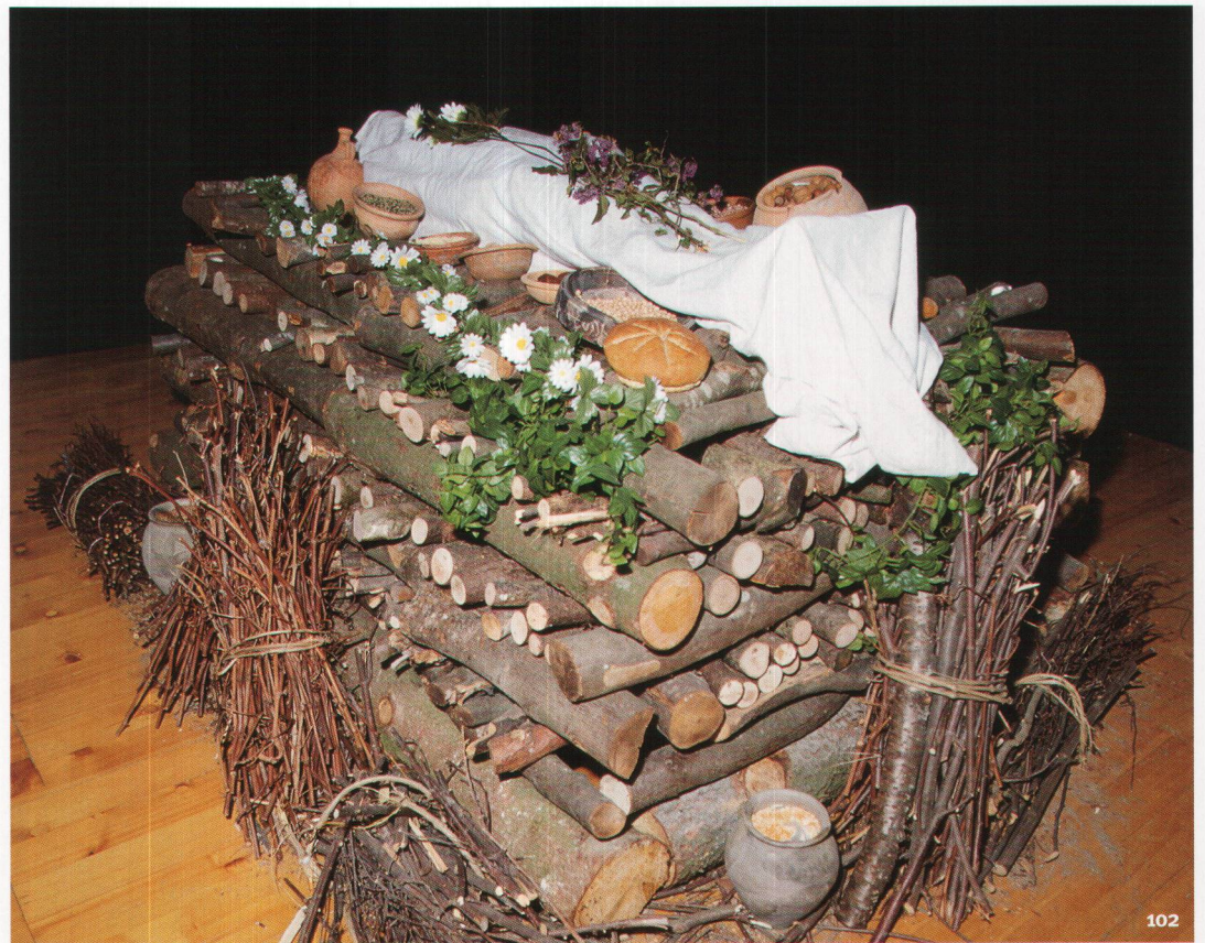
Fig. 102 Reconstitution muséographique d'un bûcher funéraire gallo-romain. Ricostruzione in museo di un rogo funebre gallo-romano.