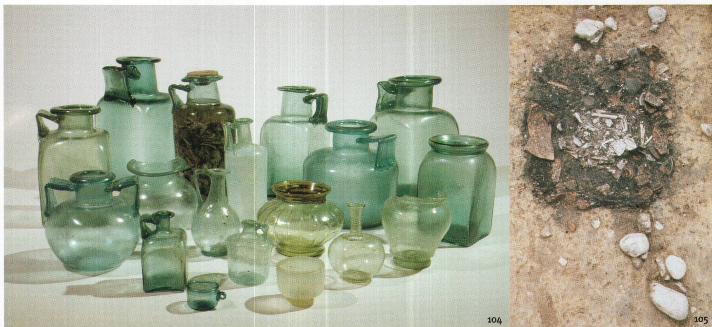
Fig. 105 Tombe à incinération de la nécropole rurale de Faoug VD, à quelques kilo- mètres d'Avenches. Les ossements calcinés (au centre) ont probablement été déposés dans un petit coffret en bois ou dans un contenant en tissu, aujourd'hui disparu.

sépultures sont pratiquement les seuls témoins susceptibles d'éclairer les croyances funéraires des populations gallo-romaines. De fait, il est très délicat de relever parmi ces gestes répétitifs et peu variés ceux qui relèvent d'une véritable conviction collective ou individuelle. Le dépôt d'offrandes alimentaires, de boissons et d'effets personnels (éléments de parure, instruments de toilette) semble en tout cas témoigner d'une croyance en une certaine forme de survie, que ne