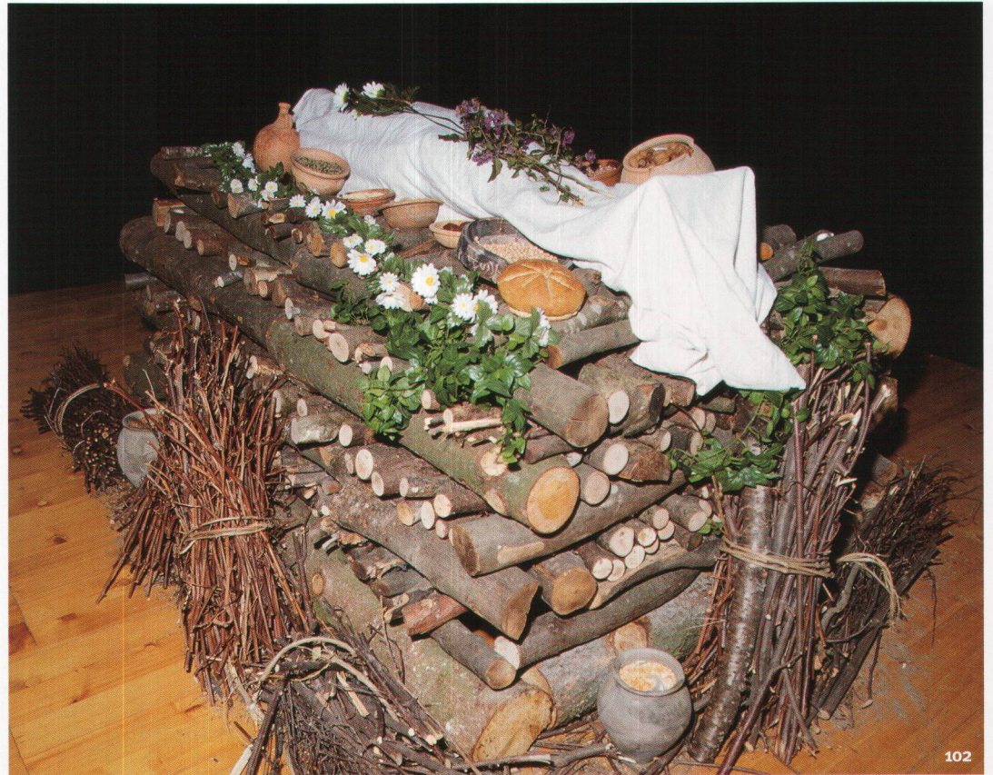
Fig. 102 Reconstitution muséographique d'un bûcher funéraire gallo-romain. Ricostruzione in museo di un rogo funebre gallo-romano.