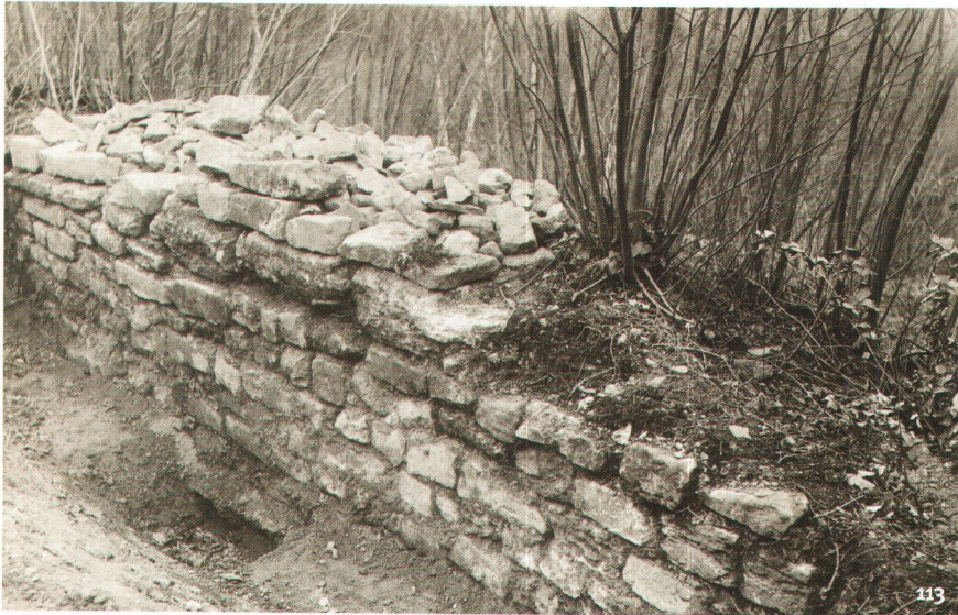
Fig. 113 Tronçon de la fortification du Bas-Empire au Bois de Châtel, dégagé par Albert Naef en 1910.

Troncone di fortificazione del tardo impero nel Bois de Châtel, messa in luce da Albert Naef nel 1910.