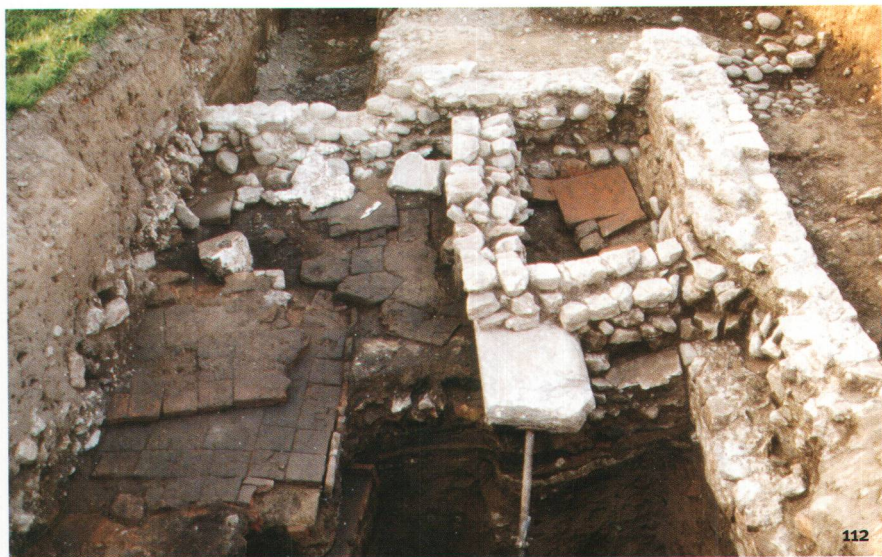
Fig. 112 Foyers et fumoir d'époque tardive (fin 3 e - 1 er tiers du 4 e s. apr. J.-C.) mis au jour près du théâtre, au lieu-dit En Selley.

Focolari e fumigatoio d'epoca tarda (fine III - primo terzo del IV sec. d.C.) rinvenuti in località En Selley, vicino al teatro.