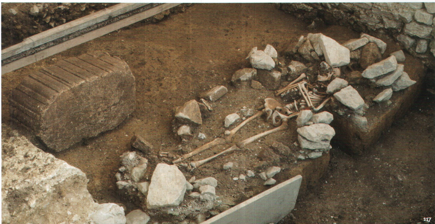
Fig. 117 Tombe à inhumation datée du début du 11 e siècle mise au jour à proximité du temple gallo-romain de la Grange des Dîmes.

Inumazione dell'inizio dell'XI sec., emersa in prossimità del tempio gallo-romano di la Grange des Dîmes.