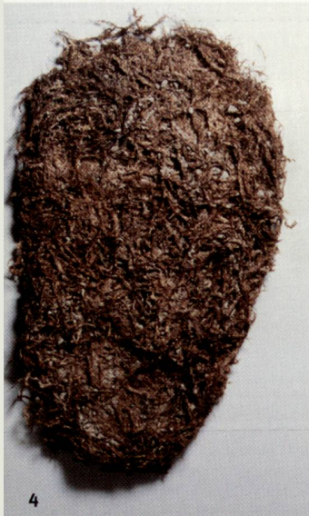
Abb. 4 Rheumasohle aus Neckera crispa -Moos von der Fundstelle Zug-Schützenmatt.

Semelle contre le rhumatisme en mousse (neckera crispa), provenant du site de Zoug-Schützenmatt.