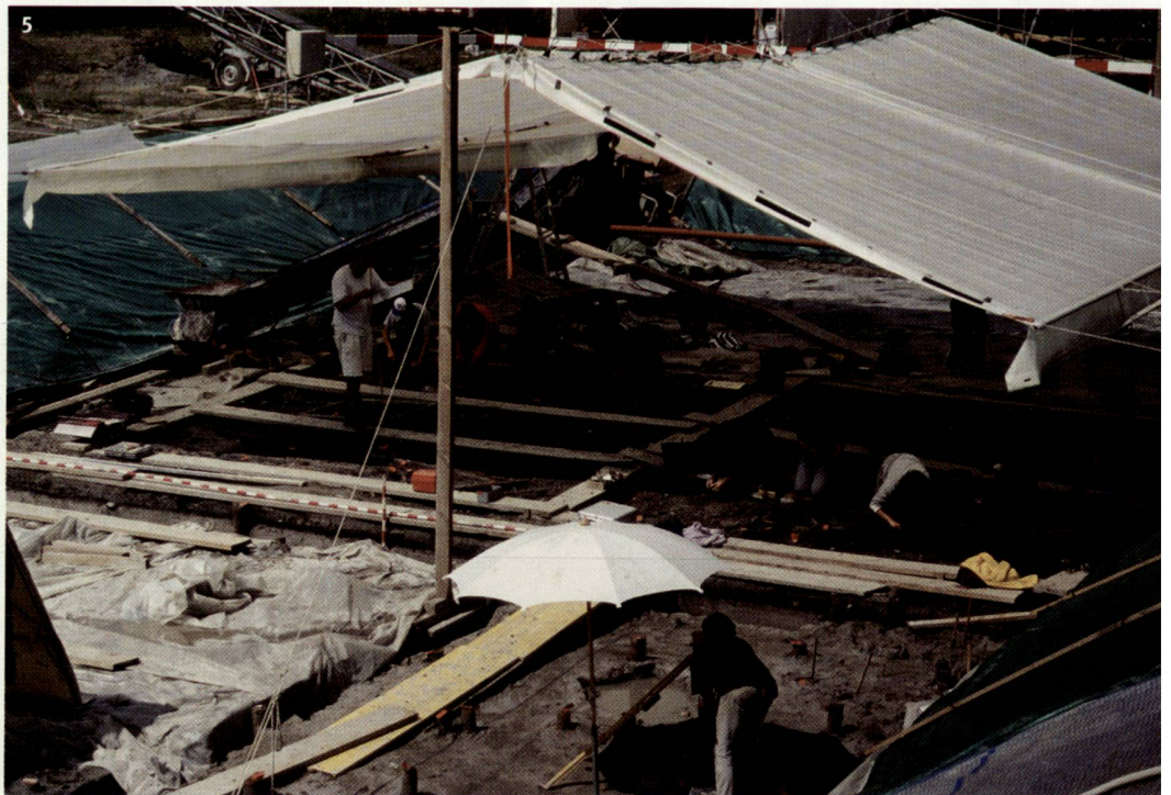
Abb. 5 Grabungskampagne 1994 in der Seeufersiedlung Arbon-Bleiche 3. Campagne de fouille de 1994 dans le site riverain d'Arbon-Bleiche 3. Campagna di scavi del 1994 nell'in- sediamento lacustre di Arbon- Bleiche 3.

Anhand von Mikrofossilien im Feuerstein kann der geologische Herkunftsort des Rohmaterials bestimmt werden. In Arbon-Bleiche 3 wurde Silex aus Nordfrankreich, aus Süddeutschland, aus Österreich und aus Oberitalien gefunden.