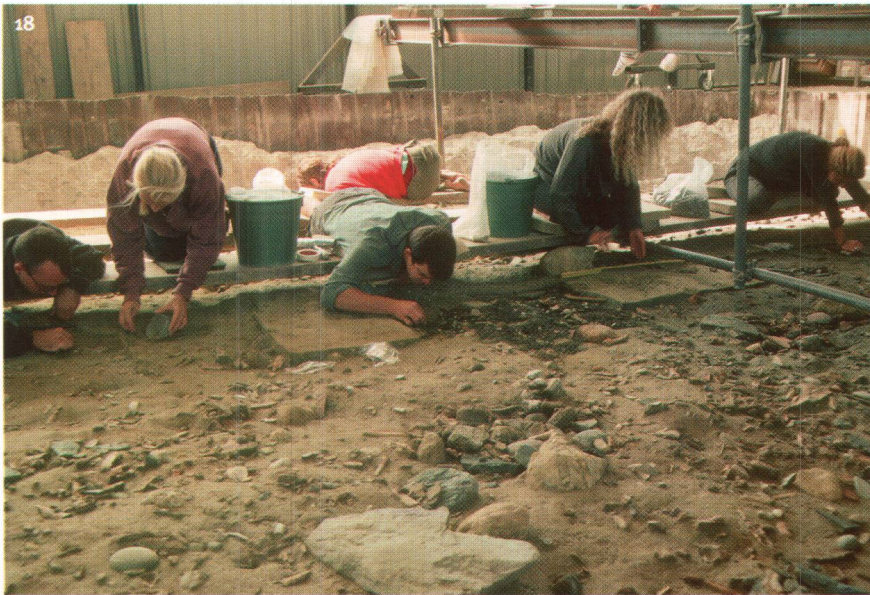
Abb. 18 Grabungen an der magdalénienzeitlichen Fundstätte Neuenburg/Monruz, die sich durch die hervorragende Erhaltung ihrer Befunde auszeichnet.

Scavo della stazione magdaléniana di Neuchâtel/Monruz, che si distingue per il suo eccezionale stato di conservazione.