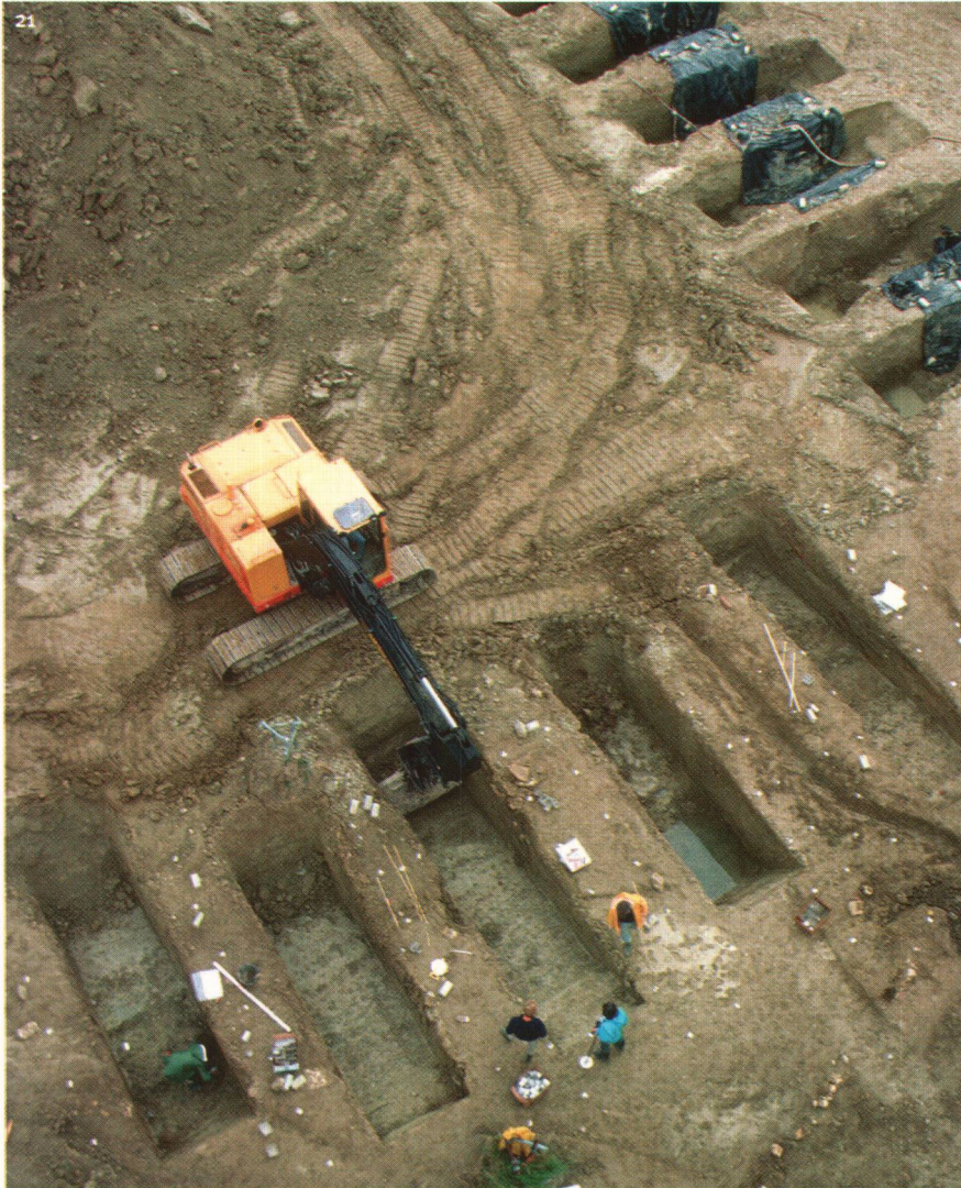
Abb. 21 Maschinelles Abtragen der Ostecke der keltischen Viereckschanze von Marin-Epagnier/Les Bourguignonnes (2.-1. Jh. v.Chr.).

Scavo alla pala meccanica dell'an- golo orientale del perimetro celtico di Marin-Epagnier/Les Bourguignonnes (II-I sec. a.C.).