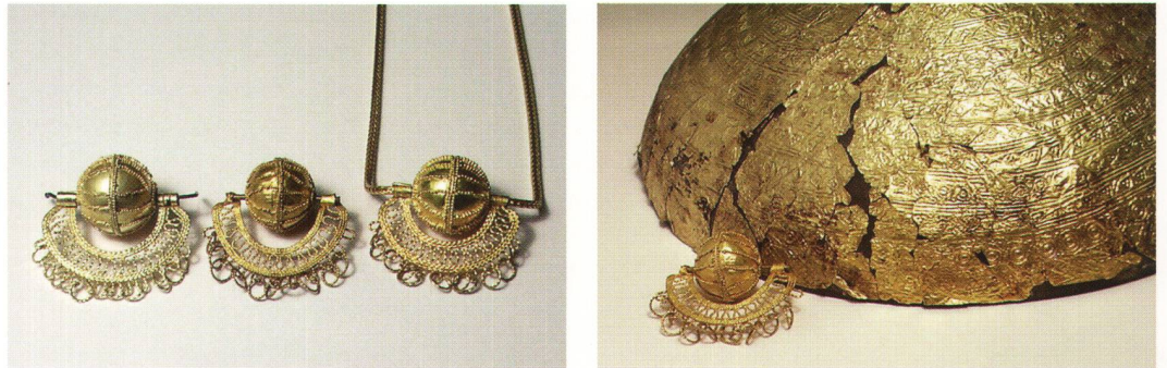
Abb. 5 Zwei gleich alte Goldgegenstände aus der gleichen Legierung. Das Goldgehänge zeigt gleichmässige Feingoldfarbe, die Blechschale hellgelbe und feingoldfarbene Partien, durchsetzt von braunen Oxidflecken.

Qualität der Arbeit aus heutiger Sicht dadurch vermindert wird! Ebenso wird dadurch gezeigt, dass nicht allein aus dem Umstand, dass bei einer Granulationsarbeit die Kugelzwischenräume mit Lot ausgefüllt sind, auf die Verwendung von metallischem Streulot geschlossen werden kann.