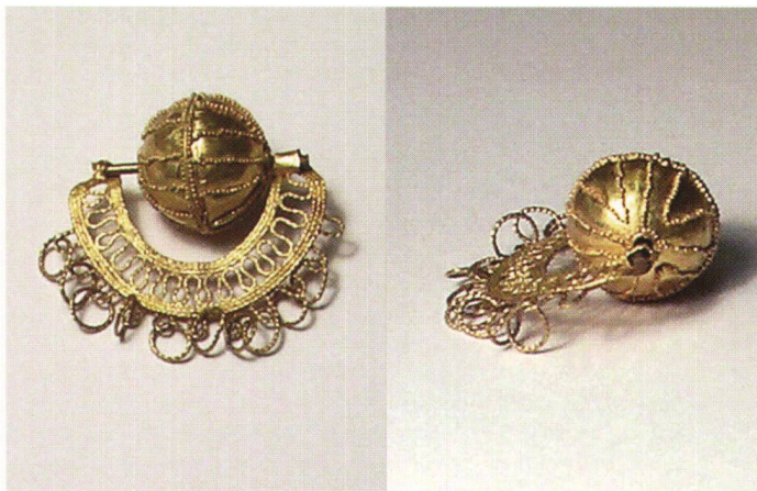
Abb. 1 Das Goldgehänge von Jegenstorf.

in irgendeiner Weise um den Hals getragen worden sein. Von einer solchen Aufhängevorrichtung wird im Fundbericht jedoch nichts erwähnt, d.h. sie ist im Boden zerfallen oder ihre Reste wurden bei der Grabung übersehen. Jedenfalls war sie nicht aus einem beständigen Edelmetall, wohl eher aus textilem Material oder Leder. Nicht entschieden ist die Frage, wo