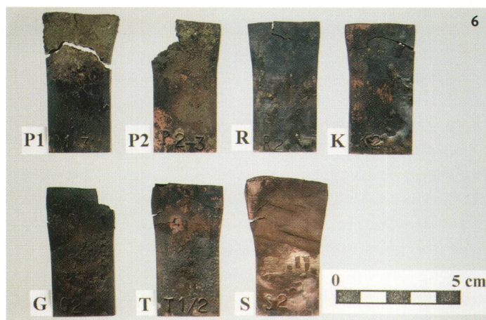
Abb. 6 Die Archäometrie erlaubt es, Kupferlegierungen von römischen Metallobjekten zu bestimmen. Mit der experimentellen Archäologie wird das Verhalten von nachgegossenen antiken Kupfer-, Zinnbronze-, Bleibronze-, Tombak- und Messinglegierungen beim Kaltschmieden ermittelt: Die einen sind duktil und gut formbar (unten rechts), andere extrem spröde (oben links) und nur zum Giessen geeignet.

ne Beobachtung am Original – erschlossene Interpretationen im praktischen Plausibilitätstest zu überprüfen. Es fehlen bei uns Programme und Projektmittel, die es erfahrenen Experimentatoren und Analytikerinnen erlauben würden, reproduzierbar, gut dokumentiert und mit klar definierten Testvorgaben die Techniken und Wirtschaftsweisen unserer Vergangenheit zu erforschen und praktisch nachzuvollziehen – unter Ausleuchtung aller Konsequenzen für die damalige Gesellschaft. Dass in der Schweiz dennoch viele und auch im Ausland beachtete Erkenntnisse – von der jungsteinzeitlichen Silexbearbeitung bis zur frühmittelalterlichen Eisenverhüttung – erarbeitet werden konnten, ist einzig dem Idealismus der rund zwei Dutzend Aktiven der 1993 gegründeten «Arbeitsgruppe für Experimentelle Archäologie in der Schweiz» zu verdanken. | Alex R. Furger