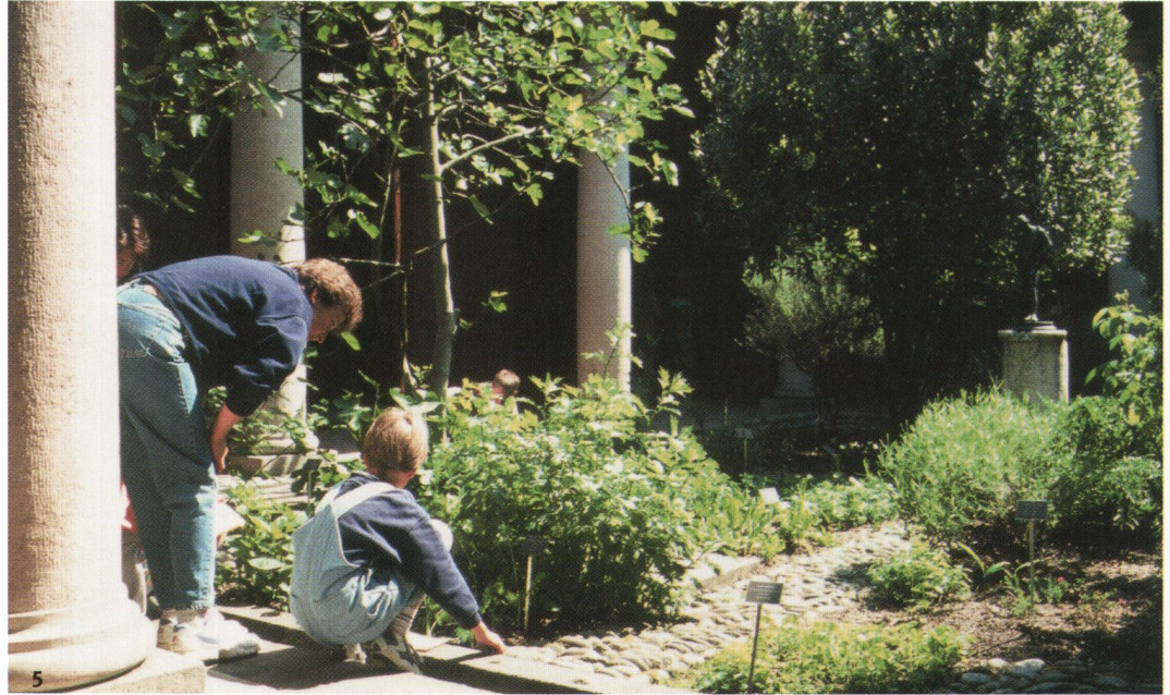
Abb. 5 Zahlreiche Nutz-, Zier- und Heilpflanzen werden im Peristyl des Augster Römerhauses gezogen. Sie alle sind entweder von antiken Autoren bezeugt oder aber archäobotanisch in der römischen Schweiz nachgewiesen. Im Bildausschnitt sind links Feigenbaum und Küchenkräuter (u.a. Beifuss) und rechts Zierpflanzen (Veilchen, Lavendel usw.) zu sehen.

falls Anspruch auf ihren «return on investment». Deshalb hat es an den Römerfesten jeweils besonders viele Handwerkerinnen und Handwerker, die Schulter an Schulter mit Archäologinnen und Archäologen die Rohmaterialien zeigen, die historisch und empirisch ermittelten Herstellungsverfahren demonstrieren und ihre Produkte vorführen: So spannend kann Archäologie sein! Als Fazit möchte ich betonen, dass