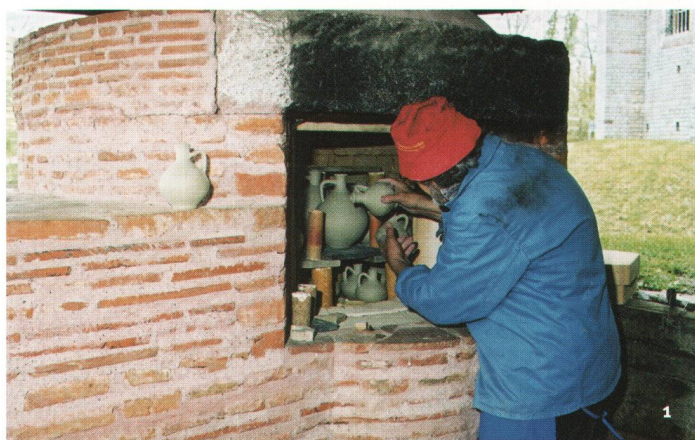
Abb. 1 Der «römische» Experimentiertöpferofen in Augusta Raurica erlaubt es, wichtige Erkenntnisse und Erfahrungen zum Brennvorgang zu sammeln. Sein Standort bei der Curia und seine innere Isolation mit modernen Schamottsteinen sind jedoch nicht authentisch.

Römerfest am letzten August-Sonntag in Augusta Raurica: Angeregt durch die intensiven archäobotanischen und archäozoologischen Untersuchungen in der Römerstadt und gestützt auf antike Kochbuchautoren sind in der «Spelunca» Römerwürste ( Apicius lucanicae ) und nach antiken Abgaben gebrauchtes