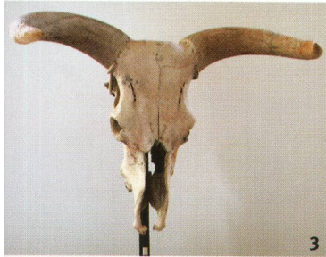
Abb. 3 Schädel eines Auerochsen.