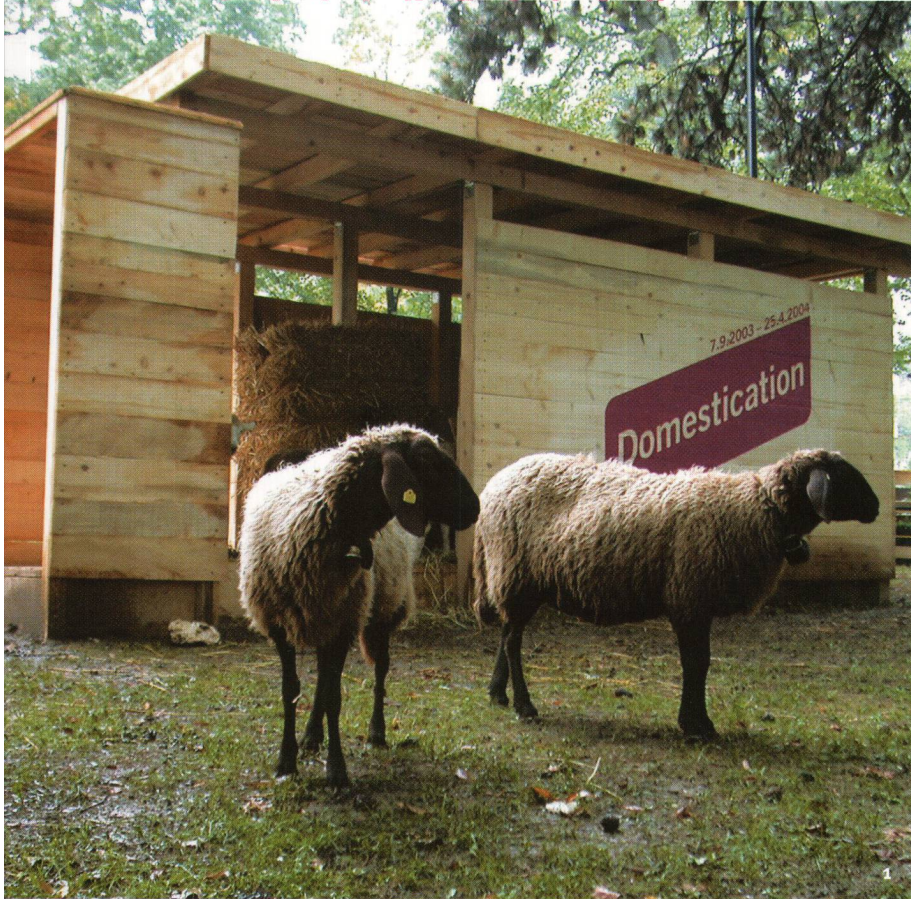
Abb. 1 Tierpark im Museumsgarten mit seltenen Nutzierrassen. Sie sind in ihren Proportionen und Dimensionen am ehesten vergleichbar mit den vorgeschichtlichen Haustiern.

Le parc aux animaux, dans le jardin du musée, avec des exemples d'espèces domestiques rares. Par leurs dimensions et leurs proportions, ces spécimens sont comparables aux animaux domestiques préhistoriques.