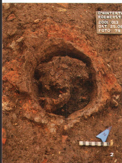
Abb. 2 Oberwinterthur. Einer der zwei Eisenöfen an der Römerstrasse 155/157.

Oberwinterthour. L'un des deux fours destinés au travail du fer à la Römerstrasse 155/157.