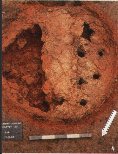
Abb. 4 Oberwinterthur. Der Töpferofen an der Gebhartstrasse. Blick auf den Mittelpfeiler und die Lochten der intakten Westhälfte.

Oberwinterthur. Le four de potier de la Gebhartstrasse. Vue sur le pilier central et la sole de la moitié occidentale du four, seule conservée.