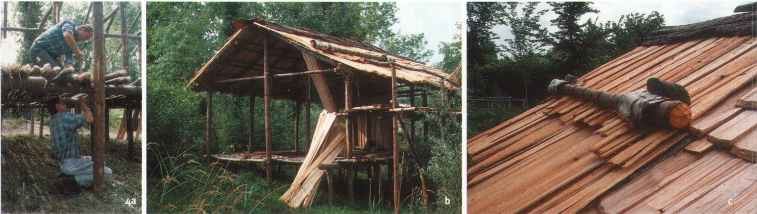
Abb. 4 Bau von Haus 23 Arbon-Bleiche 3. a) Bau des Bodenrosts. b) Die gespaltenen Bretter wurden im Dach- und Wandbereich verbaut. c) Detail Schindeldach mit Stein. d) Das fertiggestellte Gebäude rechts neben dem Hornstaad-Haus.

Die zweischiffige Konstruktion ist 8 m lang und 4 m breit. Beim Nachbau hielt man sich detailgetreu an die Holzart, die Einschlag-Orientierung, den Durchmesser sowie die Lage der Pfähle. So wurden für die Firstreihe die Weisstannenpfähle mit dem Wip-