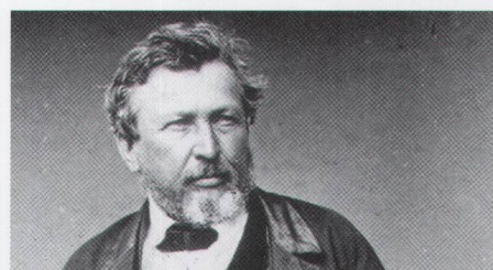
Edouard Desor (1811-1882).

immer im Zentrum archäologischer Bemühungen ist. Romands im Widerspruch zum «Sonderfall Pfahlbauer». Durch ihre Deutung der Pfahlbaufunde konstruieren die Antiquare unter der Regie von Ferdinand Keller eine Art Elfenbeinturm: Die Siedlungen an den Seeufersiedlungen wurden einem ganz bestimmten Volk, eben den «Pfahlbauern» zugeschrieben, und die Untersuchung von deren Hinterlassenschaft hatte vor allem zum Ziel, die Lebensweise der ersten Schweizer in den nebulösen Zeiten vor der römischen Besetzung kennenzulernen; d.h. man wollte dem Schweizerischen Bundesstaat von 1848 einzigartige Vorfahren verschaffen. Doch sowohl der Waadtländer Frédéric Troyon als