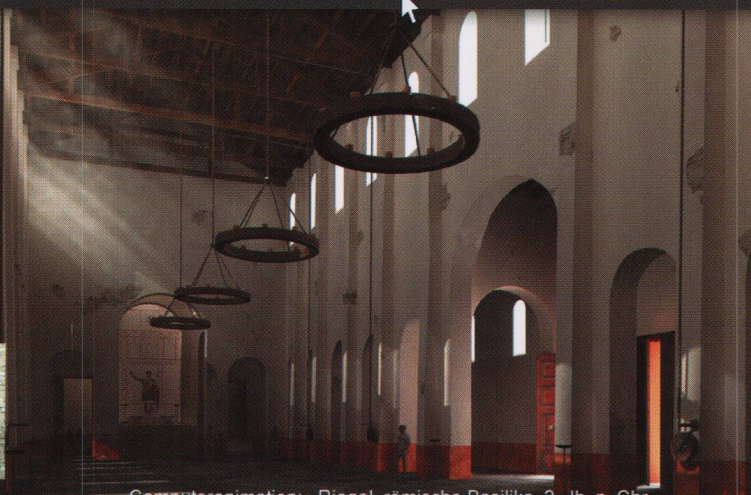
Computeranimation: Biegel, römische Basilika, 2. Jh. n. Chr.