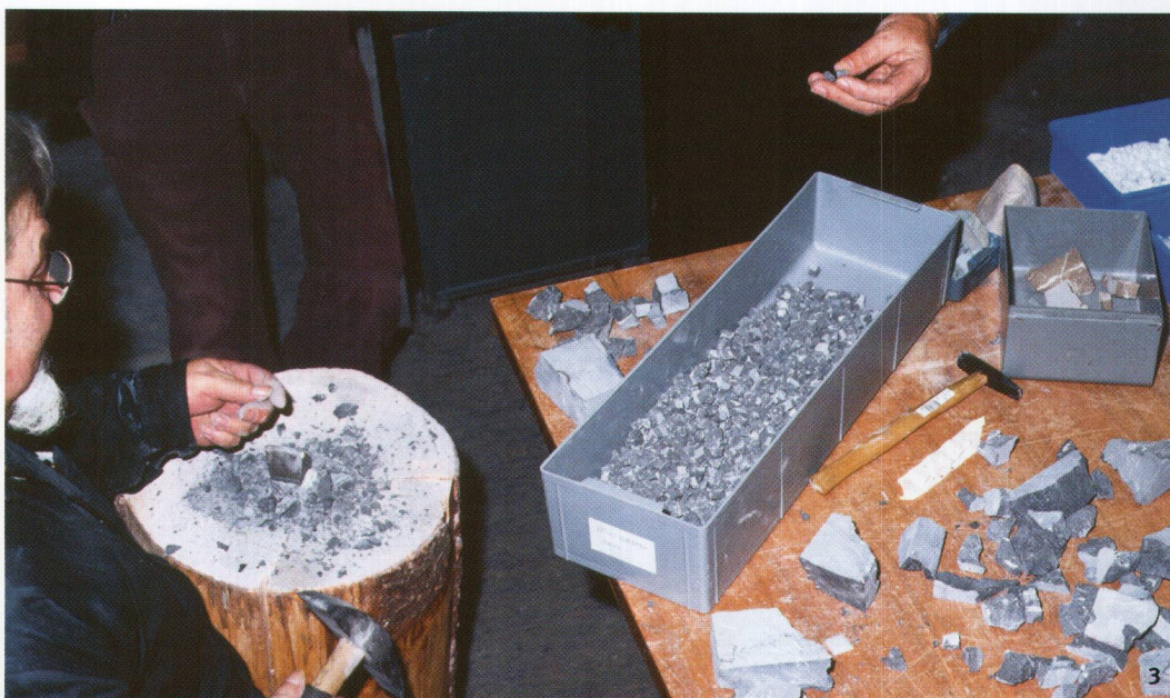
Abb. 3 Jeder Stein wird von Hand geschlagen.

Bei dieser vor dem 19. Jh. nicht nachgewiesenen, heute aber gängigen Methode werden die Mosaiksteine zuerst in direkter Setzung in eine provisorische, nicht härtende Unterlage aus Kalk, Ton oder Sand gesetzt. Das so vollendete Mosaik wird mit einem löslichen Leim überstrichen und mit Gazeschichten oder Leinwandtuch überdeckt. Nach dem Erhärten kann das Mosaik vom provisorischen Bildträger entfernt und gereinigt werden. Je nach Grösse wird es in einzelne Teile zerschnitten,