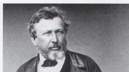
Edouard Desor (1811-1882).

vase clos: la fouille et l'étude des matériaux palafittiques, rapportés à un prétendu «peuple lacustre», devaient avant tout éclairer les mœurs des ancêtres de la Suisse aux temps obscurs d'avant la conquête romaine, en d'autres termes le «génie» de ces précurseurs de la nation, de l'Etat fédéral de 1848... Or, à l'instar du Vaudois Frédéric Troyon, des naturalistes, comme le Bernois Adolphe Morlot (enseignant à l'Université de Lausanne) et le Neuchâtelois Edouard Desor, ont d'emblée récuser une telle restriction au seul passé de la patrie helvétique. Entretien d'innombrables contacts scientifiques d'un bout à l'autre de l'Europe, ils ont chacun