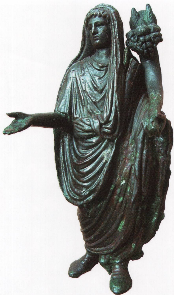
Fig. 2 Génie domestique, statuette en bronze ayant donné son nom à la domus à péristyle de l' insula 8 (en face du forum).

Schutzgott des Hauses, Bronzestatue, die der Domus mit Peristyl der Insula 8 (gegenüber dem Forum) den Namen gegeben hat.