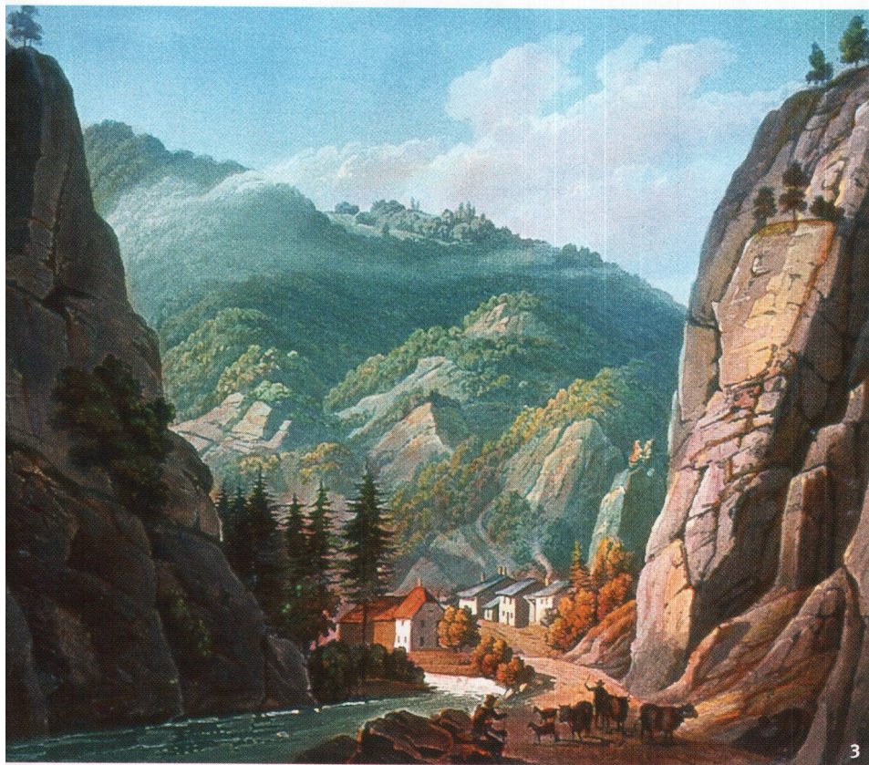
Fig. 3 Vue de la verrerie de Rebeuvelier, au bord de la Birse, vers 1836. Gravure colorisée de Winterlin, Schreiber et Walz, Bâle.

La vetreria di Rebeuvelier, sulle rive della Birse, attorno al 1836. Incisione acquerellata di Winterlin, Schreiber e Walz, Basilea.