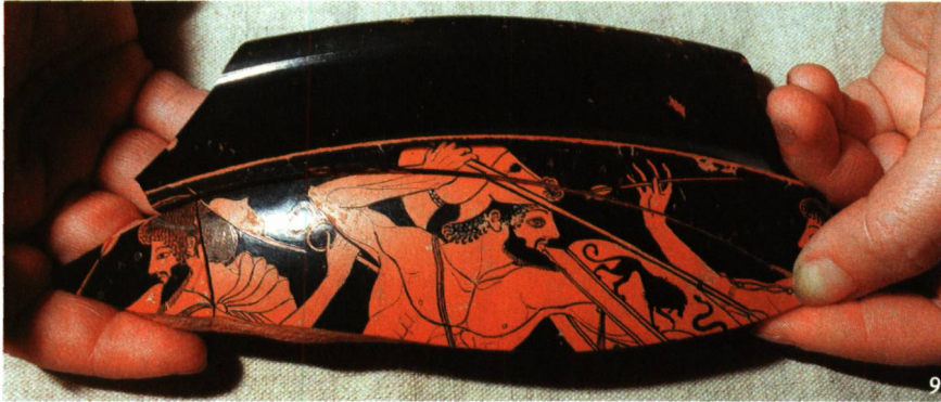
Abb. 9 USA. Fragment eines antiken Trinkgefäßes, welches das Getty Museum 1999 an Italien zurückgab.

USA. Fragment d'une coupe antique que le Musée Getty restitua à l'Italie en 1999.