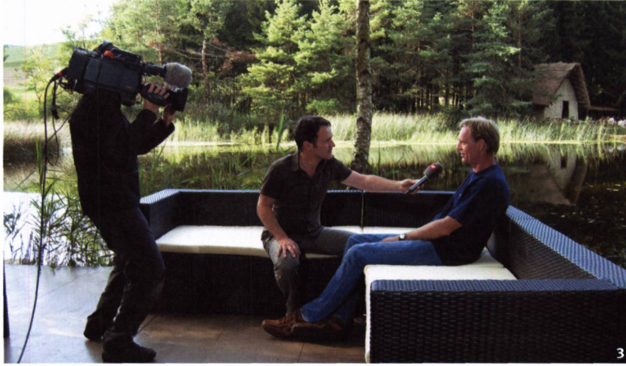
Abb. 3 Expertengespräch auf der Plattform vis-à-vis des Set.

Discussion avec un expert sur la plate- forme, en face du lieu de tournage.