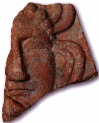
Antéfixe du sanctuaire gallo-romain (seconde moitié du 1 er -3 e siècle apr. J.-C.).

Une antéfixe a été découverte lors de la fouille du sanctuaire gallo-romain de Saint-Gervais. C'est une plaque fragmentaire de terre cuite représentant un visage féminin à chevelure frisée et bouche fermée. L'œil, sous une arcade sourcilière saillante, est en forme de demi-lune soulignée par la paupière. Le menton est marqué par une fossette circulaire en relief. Des éléments d'une palmette rayonnante sortent de derrière le visage. Sans critère d'identification plus précis, on peut penser à un visage soit de divinité féminine soit de gorgone, représentation des plus fréquentes sur les antéfixes d'époque romaine. La bouche fermée ne permet pas d'y voir un masque de théâtre. Le travail fin et soigné, le relief prononcé, le rendu assez réaliste et la souplesse des courbes du décor la rattachent plutôt aux exemplaires de l'Italie romaine qu'aux antéfixes des provinces gau-