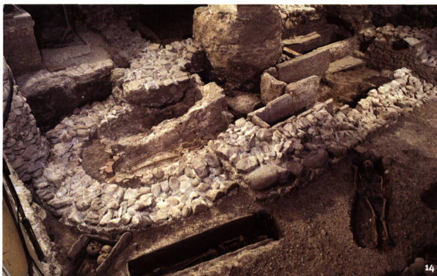
Fig. 14 L'annexe à abside édiflée au 6 e siècle à l'est de l'église. Vue vers le sud.

Der apsidenförmige Annexbau wurde im 6. Jh. im Osten an die Kirche angebaut. Blick nach Süden.