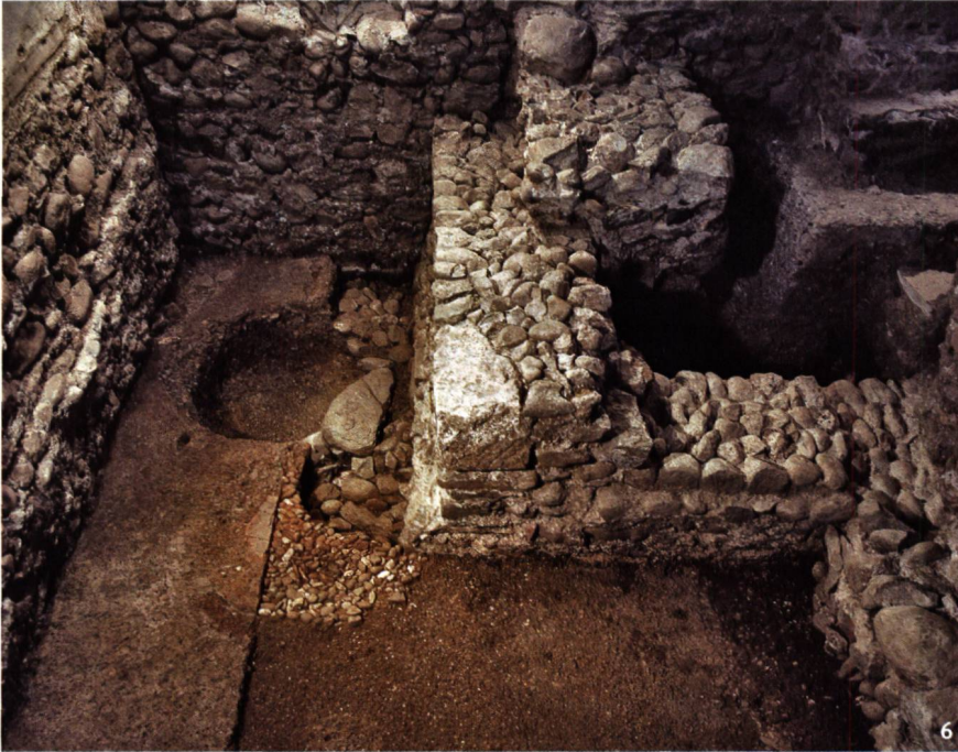
Fig. 6 Un foyer de l'époque augustéenne coupé par une annexe de l'église funéraire paléochrétienne.

Eine in augusteische Zeit datierende Feuerstelle wird von einem Annexbau der frühchristlichen Bestattungskirche geschnitten.