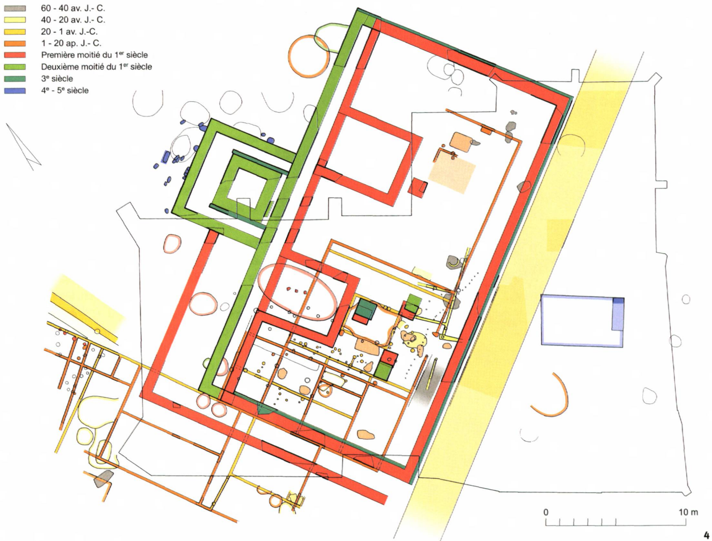
Fig. 4 Plan schématique des vestiges pré-romains et romains.

Schematischer Plan der vorrömischen und römischen Strukturen.