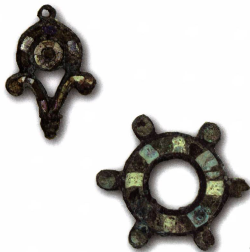
Fig. 9 Fibules en bronze émaillé (2 e -3 e siècle apr. J.-C.).

Le nouveau chantier entrepris au 3 e siècle est sans doute de grande ampleur, même si on n'en saisit pas toutes les manifestations. Les plus évidentes sont représentées par une consolidation des murs définissant l'emprise du sanctuaire, lesquels sont doublés par des maçonneries (fig. 4). Ces placages, qui interviennent parfois jusqu'au niveau des fondations, ont été observés sur trois côtés seulement. Cependant, les traces de travaux importants sont visibles autour du troisième lieu de culte. La