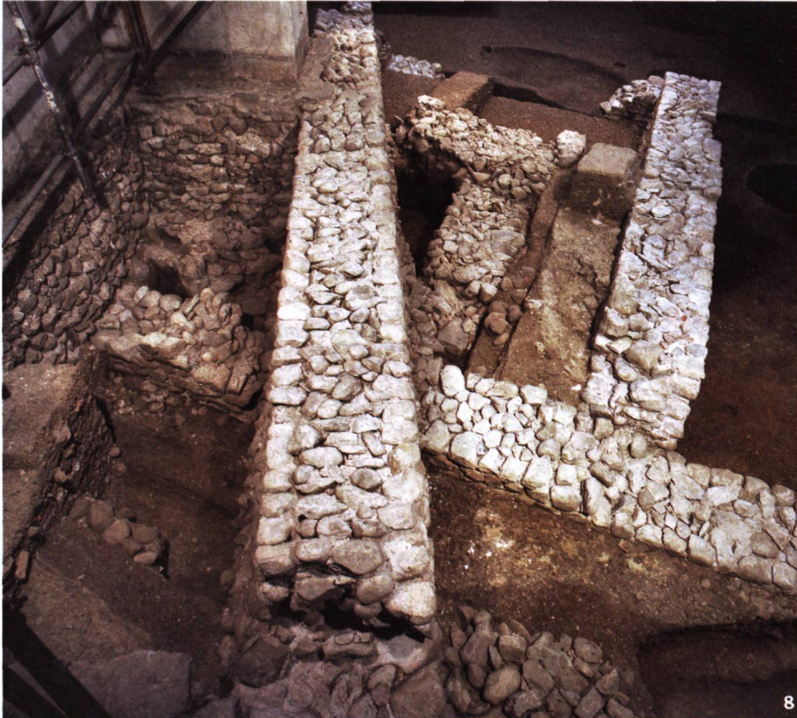
Fig. 8 Au second plan: le nouveau lieu de culte aménagé dans le sanctuaire gallo-romain (seconde moitié du 1 er siècle apr. J.-C.). Vue vers l'ouest.

Im Hintergrund die neue Kultstätte, die sich im ehemaligen gallorömischen Heiligtum aus der 2. Hälfte des 1. Jh. n.Chr. befindet. Blick nach Westen.