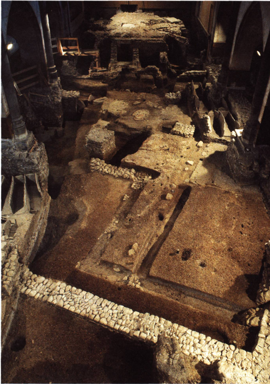
Fig. 5 Vue générale des fouilles dans la nef du temple. Au centre, les niveaux augustéens. Vue vers l'est.

Gesamtansicht der Grabungen im Kirchenschiff. In der Mitte die augus- teischen Niveaus. Blick nach Osten.