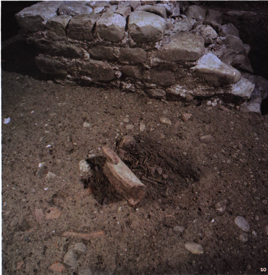
Fig. 10 Tombe de bébé placée contre une tuile courbe. Vue vers l'est.

An einen Hohlziegel angelehntes Säuglingsgrab. Blick nach Osten.