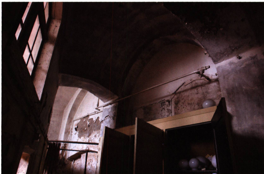
Abb. 3 Baden (AG). Untergeschoss im Hotel Ochsen. Wieviel Bausubstanz aus welchen Epochen steckt in diesem Raum?

dererseits liefern Anwohner und Lokalhistoriker wertvolle Informationen zur regionalen Geschichte. Kontakte bestehen auch mit Privatsammlern, um an lokale Informationen und Fundmaterial zu gelangen.