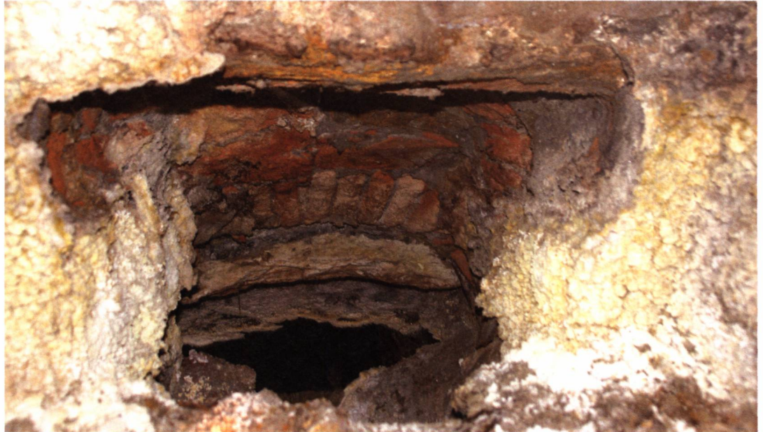
Abb. 4 Baden (AG). Hotel Bären, Hinterhofquelle. Die Quelffassung soll angeblich römisch sein.

aktenkundigen archäologischen Dokumente gesichtet. Daraus resultierte ein hoch komplexer Gesamtplan aller bislang nachweisbarer Bauten, Einrichtungen, Bodeneingriffe und archäologischen Strukturen in der Bäderstadt. Die Archivrecherchen führten zu der wichtigen Erkenntnis, dass sowohl in den Altbauten als sogar auch im Boden unter den Bauten aus den 1960er-Jahren wesentlich mehr archäologische Bausubstanz zu