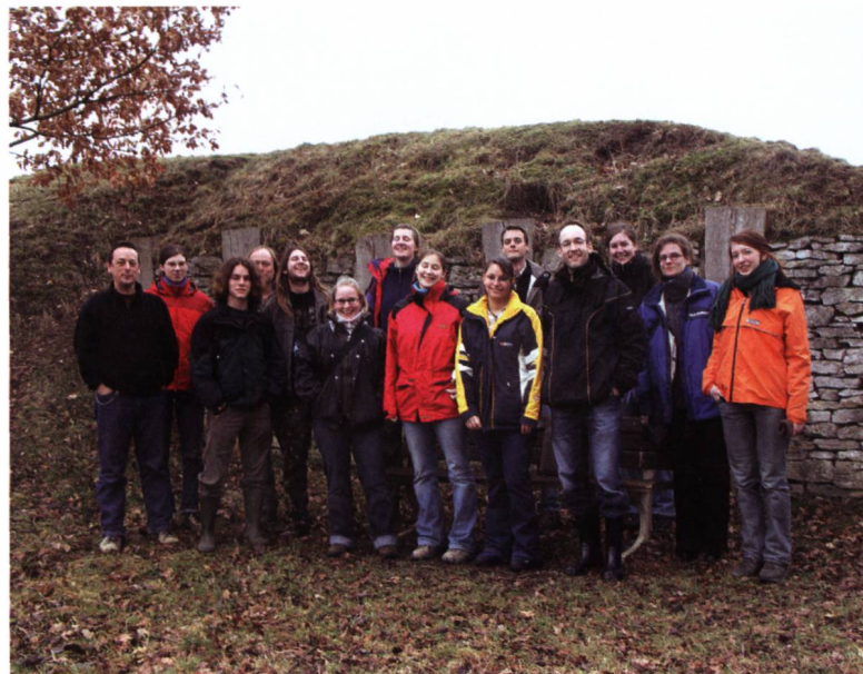
Abb. 1 Studentinnen und Studenten der Universität Zürich anlässlich eines interdisziplinären Prospektionsprojektes in Altenburg/Rheinau.

Die AGP führt anlässlich ihrer Jahresversammlung ein Kolloquium zu aktuellen Themen und Projekten im Bereich der Prospektion durch, wobei stets die Praxis im Vordergrund stehen soll. Die AGP steht in stetigem Austausch mit den anderen archäologischen Arbeitsgruppen der Schweiz (AGUS, ARS, IFS, SAF, SAKA und SAM) und Archäologie Schweiz. Zur Zeit ist ein Praxishandbuch zur Prospektion in Arbeit. Im März 2008 findet in Zusammenarbeit mit dem Amt für Denkmalpflege