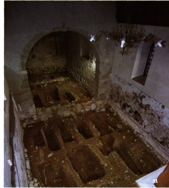
Fig. 11 Innenraum der Kirche von Présinge vor und während den archäologischen Ausgrabungen.

L'interno della chiesa di Présinge prima e durante lo scavo archeologico.