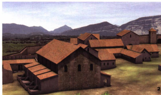
Abb. 2 Rekonstruktion der ältesten, um 380 im Schutz einer Stadtmauer errichteten Kathedrale von Genava.

Die Grenzen der Diözese von Genf sind für diese Epoche nicht klar definiert. Einige Autoren sind der Meinung, dass diese nicht nur die antike Stadt Nyon, sondern auch Avenches miteinbezogen hat. Die Diözese von Genf hätte sich folglich im Schweizerischen Mittelland in Richtung Nordosten erstreckt und die Civitas von Nyon sowie ein Teil des Gebiets der Civitas der Helvetier beinhalten.