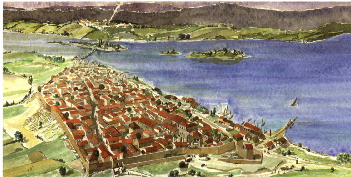
Abb. 3 Rekonstruktionszeichnung (Aquarell) der Siedlung Genava in der Spätantike.

Ricostruzione acquerellata della città di Genova durante l'epoca tardoantica.