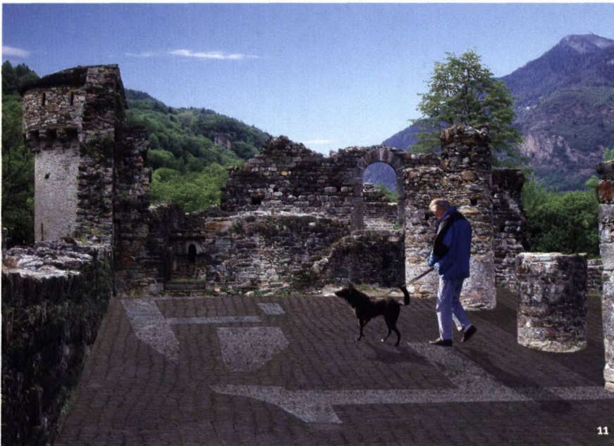
Fig. 11 Particolare del progetto di valorizzazione riguardante il cortile interno.

Detail des für das Publikum gestalteten Innenhofs.