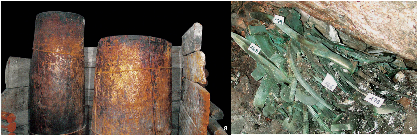
Abb. 8 Mittelbronzezeitliche Quellfassung von St. Moritz (GR).

Tschiffada da funtauna dal temp da bronz mesaun a San Murezzan (GR).