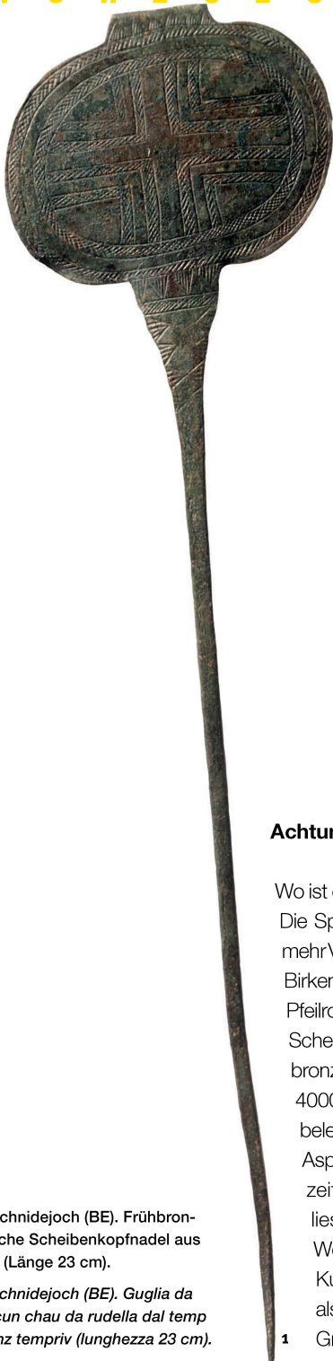
Abb. 1 Lenk-Schnidejoch (BE). Frühbronzezeitliche Scheibenkopfnadel aus Bronze (Länge 23 cm).

Lenk-Schnidejoch (BE). Guglia da bronz cun chau da rudella dal temp da bronz tempriv (lunghezza 23 cm).