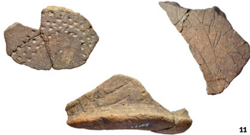
Herblingen-Grüthalde. Tessons de céramique issus des fouilles de 1918/19 et de 1938/39, avec leurs décors gravés ou poinçonnés caractéristiques. Ils datent la couche archéologique dans la période un peu avant ou autour de 4000 av. J.-C.