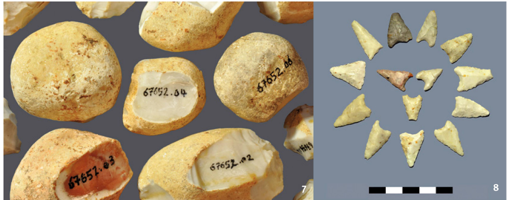
Abb. 8 Büttenhardt-Zelg. Auswahl neolithischer Pfeilspitzen. Auffallend sind die Asymmetrie sowie die unregelmässigen Kantenverläufe mit teils gut erkennbaren Ausbrüchen. Sie rühren wohl teilweise vom Gebrauch her. Skala in cm.

Büttenhardt-Zelg. Alcuni rognoni di selce in diversi stadi di lavorazione. Diametro del pezzo in alto a sinistra: 3,4 cm.