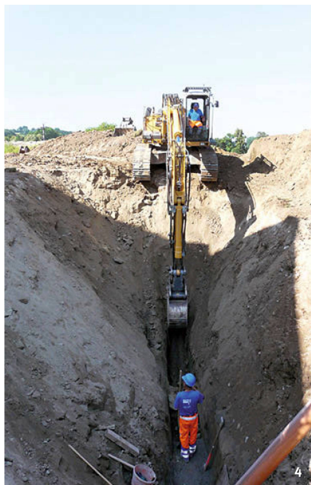
Fig. 4 Faoug. Surveillance des travaux de creuse d'une tranchée technique en 2007.

Faoug. Sorveglianza dei lavori di scavo in una trincea tecnica, nel 2007.