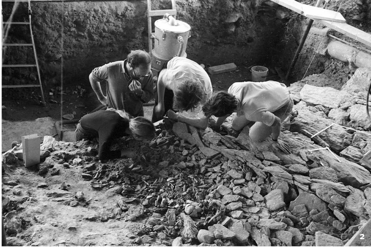
Fig. 2 Sion, Petit-Chasseur I, 1971. Déga- gement d'un amas d'os humains brûlés déposés dans une fosse le long du soubassement du dolmen M VI.

Sion, Petit-Chasseur I, 1971. Freilegen einer Ansammlung verbrannter menschlicher Knochen, die in einem Graben längs des Fundaments von Dolmen M VI zum Vorschein kamen.