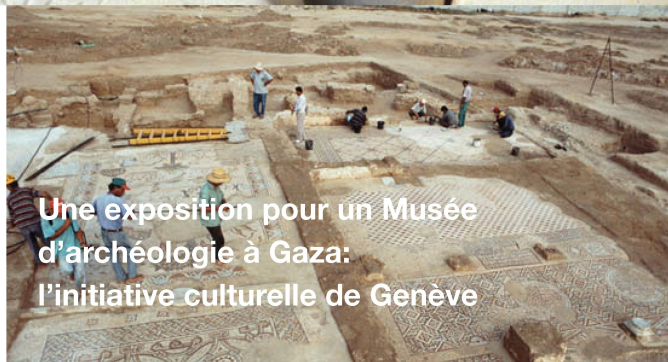
Une exposition pour un Musée d'archéologie à Gaza: l'initiative culturelle de Genève