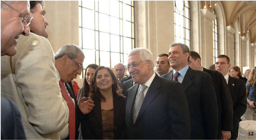
Fig. 12 Inauguration de l'exposition de Genève en 2007, en présence de S. E. Mahmoud Abbas, Président de l'Autorité Nationale Palestinienne.

Eröffnung der Genfer Ausstellung 2007 im Beisein von S.E. Mahmoud Abbas, Präsident der Palästinensischen Autonomiebehörde.