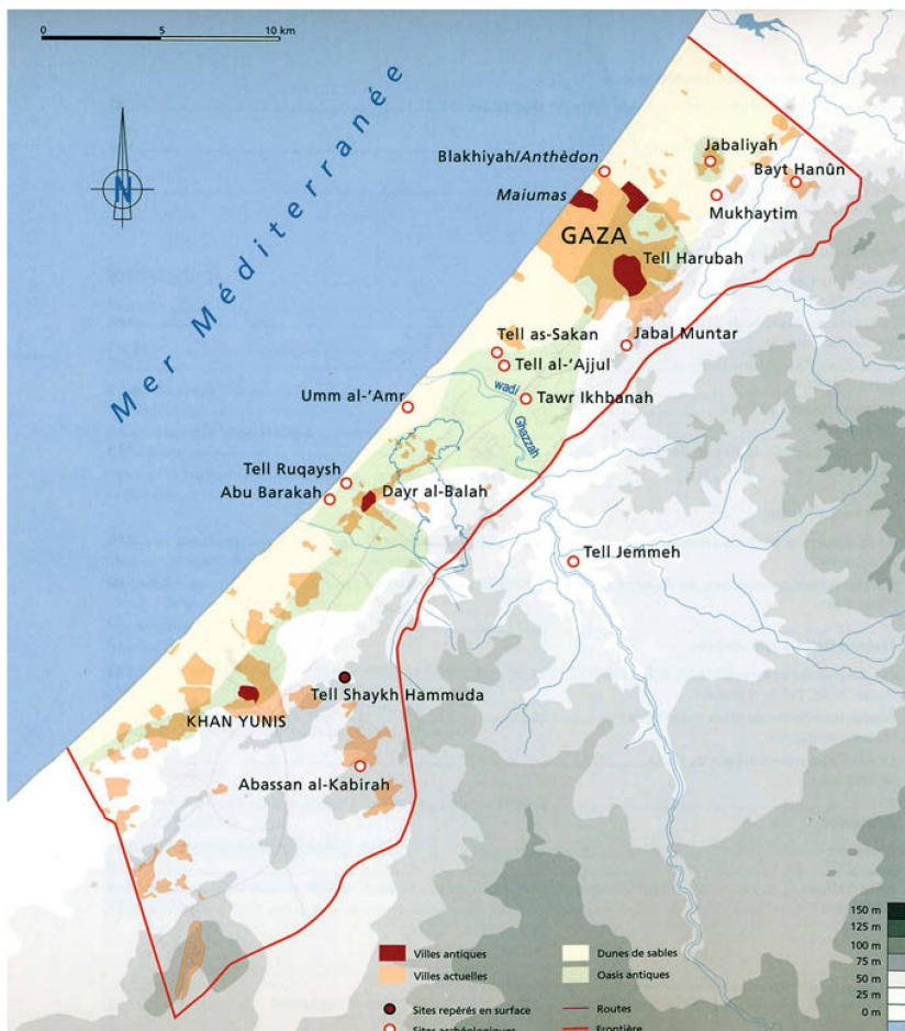
Fig. 2 Carte de la Bande de Gaza avec les principales régions archéologiques. Karte des Gaza-Streifens mit den archäologisch wichtigsten Regionen. Cartina della Striscia di Gaza con le principali regioni archeologiche.

En 1879, l'archéologie gaziote a commencé par un coup d'éclat: la découverte d'une statue monumentale de Zeus assis qui aujourd'hui trône au Musée d'Istanbul (fig. 3). En 1908, un caveau fort bien maçonné en pierre est pillé entre la ville de Gaza et la mer. La police turque réussit à sauver un sarcophage anthropomorphe de marbre blanc, identique à ceux de la nécropole de Sidon (Saïda, Liban). En 1911, dans le sillage des fouilles du Tell Abu Rumeileh (Beth Shemesh), Duncan Mackenzie, identifiant de la céramique bichrome «philistine», inaugure l'archéologie philistine.