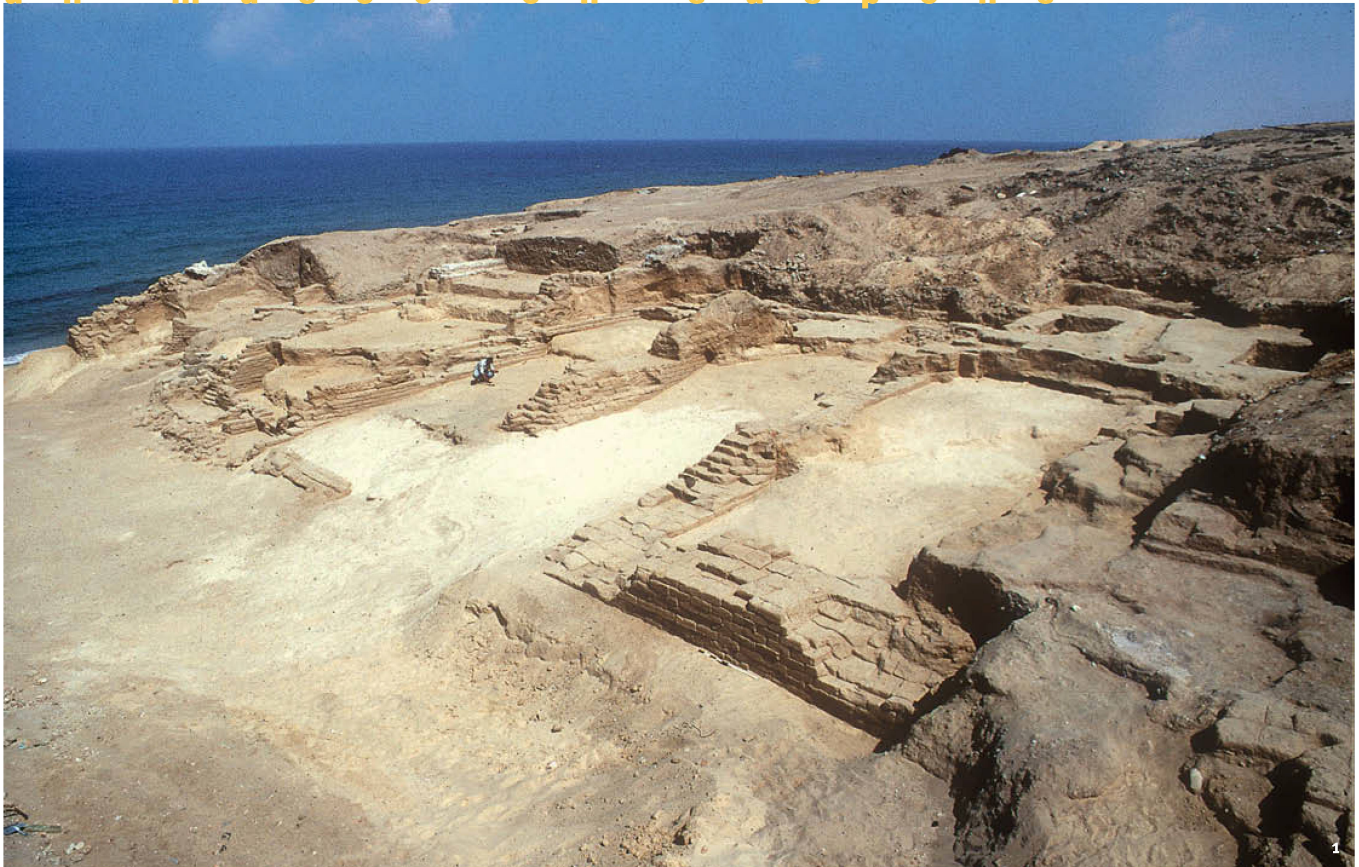
Fig. 1 Gaza-Blakhiyah. L'emporium (entrepôt) du port de l'antique Anthèdon.

Gaza-Blakhiyah. Das Emporium (Lagerhaus) im Hafen der antiken Stadt Anthedon.