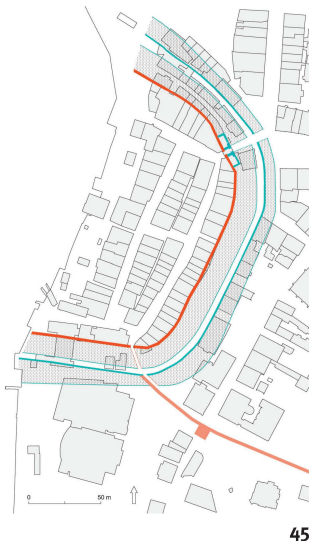
Fig. 45 La ville de Zoug, fondée au début du 13 e siècle, n'a d'abord eu pour fortification qu'une enceinte sans tours (rouge). Sous les Habsbourg, l'enceinte a été progressivement renforcée par la tour de l'Horloge (Zitturm) et un mur de contrescarpe (bleu).

La città di Zugo fu fondata nel XIII secolo; agli inizi era circondata da un muro di cinta senza torri (rosso). Essa fu rinforzata progressivamente durante la dominazione asburgica con la Torre dell'Orologio (Zitturm) e un muro doppio con camminamento interno (blu).