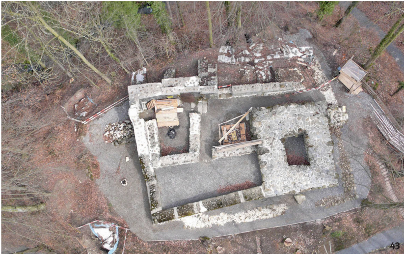
Fig. 43 Vue aérienne du château-fort de Hünenberg juste avant l'achèvement de la restauration en 2009. Les vestiges de la première enceinte, qui longeait le versant, sont à peine visibles. Les éléments bâtis datent pour la plupart du 13 e siècle, avec des restaurations dans les années 1940 et 1960.

Fotografia aerea del castello di Hünenberg poco prima della fine del restauro nel 2009: i resti del primo muro di recinzione, che correva lungo la scarpata, sono difficilmente visibili. La maggior parte dei resti conservati risale al XIII secolo oppure è dovuta ai restauri degli anni 1940 e 1960.