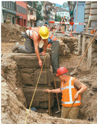
Fig. 49 Les investigations archéologiques sur des bâtiments et la surveillance des travaux sur les canalisations apportent régulièrement des éléments nouveaux à la connaissance de l'histoire de la ville de Zoug. En 2004, l'assainissement de la Neugasse a donné lieu à la mise au jour des fondations de la porte de Baar (porte Neuve), construite en 1478 et démolie en 1873.

Le indagini sugli edifici e la supervisione archeologica in occasione di lavori alle canalizzazioni portano spesso a nuove scoperte sulla storia della città di Zugo: durante i lavori di miglioria della Neugasse nel 2004 sono venute alla luce le fondamenta della porta di Baar (porta Nuova), costruita nel 1478 e distrutta nel 1873.