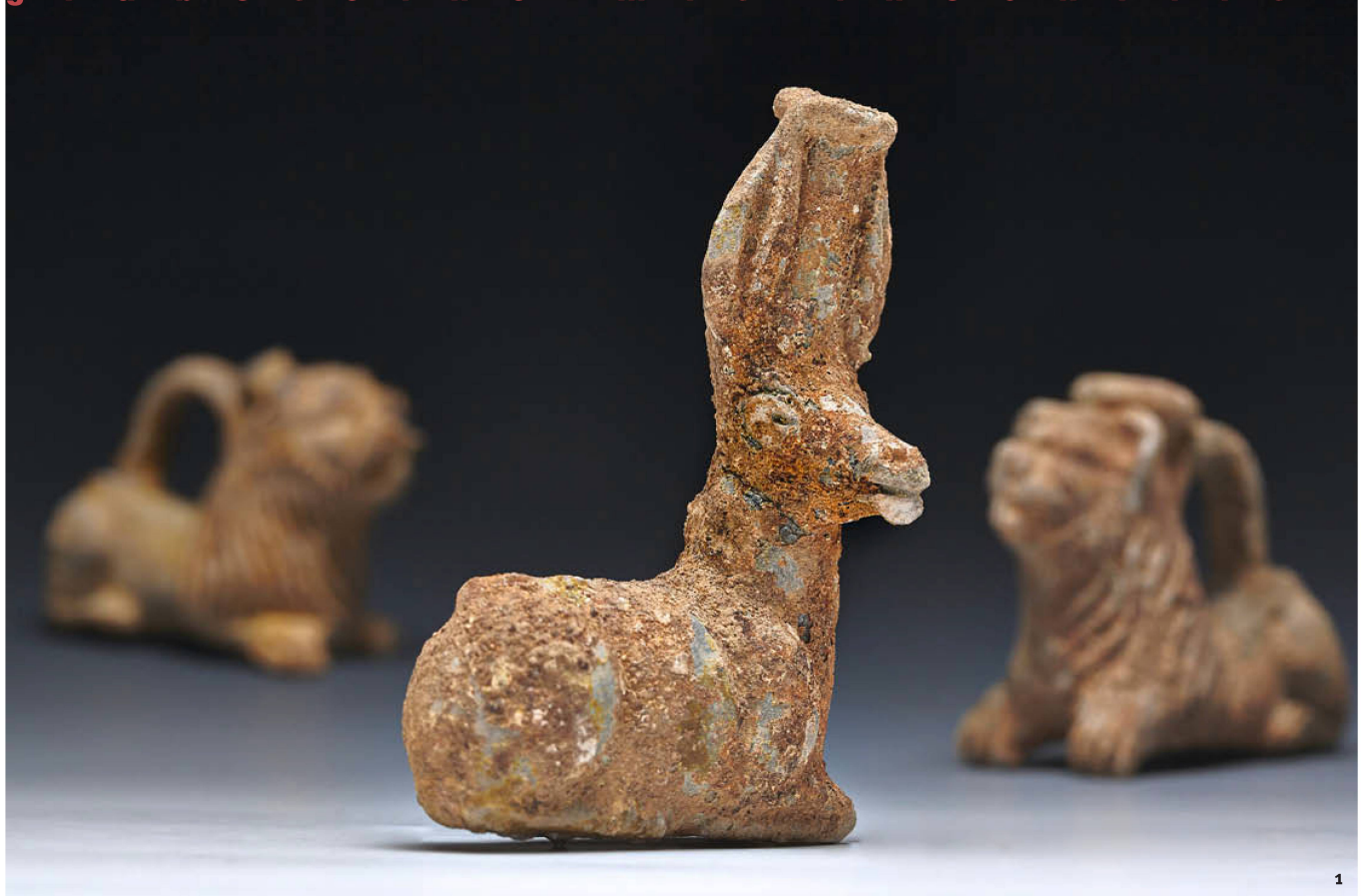
Abb. 1 Bleiglasierte Balsamarien in Tiergestalt aus den römischen Brandgräbern.

g r a b s t e i n e m i t i n s c h r i f t