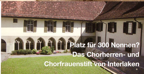
Platz für 300 Nonnen? Das Chorherren- und Chorfrauenstift von Interlaken