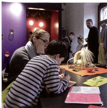
Abb. 5 Museumspädagogik wird gross geschrieben: Das Möbel «Reise durch den Boden», eine reiche Auswahl an Kostümen und Accessoires sowie Bücher und Spiele laden zum Verweilen und spielerischen Kennenlernen der Vergangenheit ein.

Un large espace est réservé à la pédagogie au sein du musée: le meuble «Voyage dans le sous-sol» ainsi qu'un vaste choix de costumes, d'accessoires, de livres et de jeux invitent à la flânerie et à l'exploration ludique du passé.