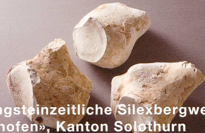
Das jungsteinzeitliche Silexbergwerk im «Chalhofen», Kanton Solothurn