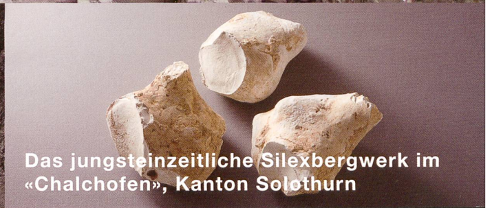
Das jungsteinzeitliche Silexbergwerk im «Chalhofen», Kanton Solothurn