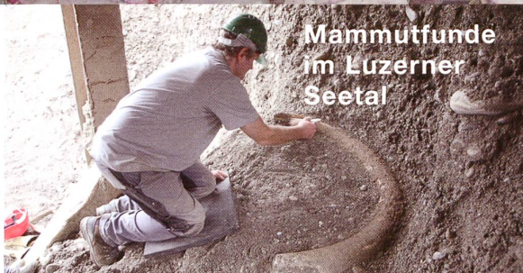
Mammutfunde im Luzerner Seetal